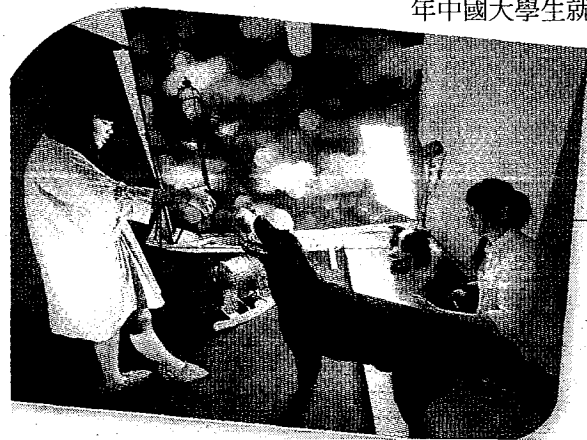
◀畢業於江蘇某專科學校的90後女孩，進行寵物攝影工作。

上海市教科院高職教育發展研究中心主任馬樹超說，5成以上的高職畢業生來自於農民工或農民家庭，職業教育平台雖提供農村學子受教機會，但高職教育仍面臨不少挑戰，當中包含高職院校缺乏發展自信、課程專業度不足等諸多問題，皆有待克服。