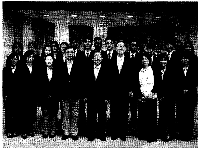
● 中信金融管理學院日本海外見習學生31日由校長施光訓率團參訪駐日代表處，駐日代表謝長廷親自接待開講並與學員合影。