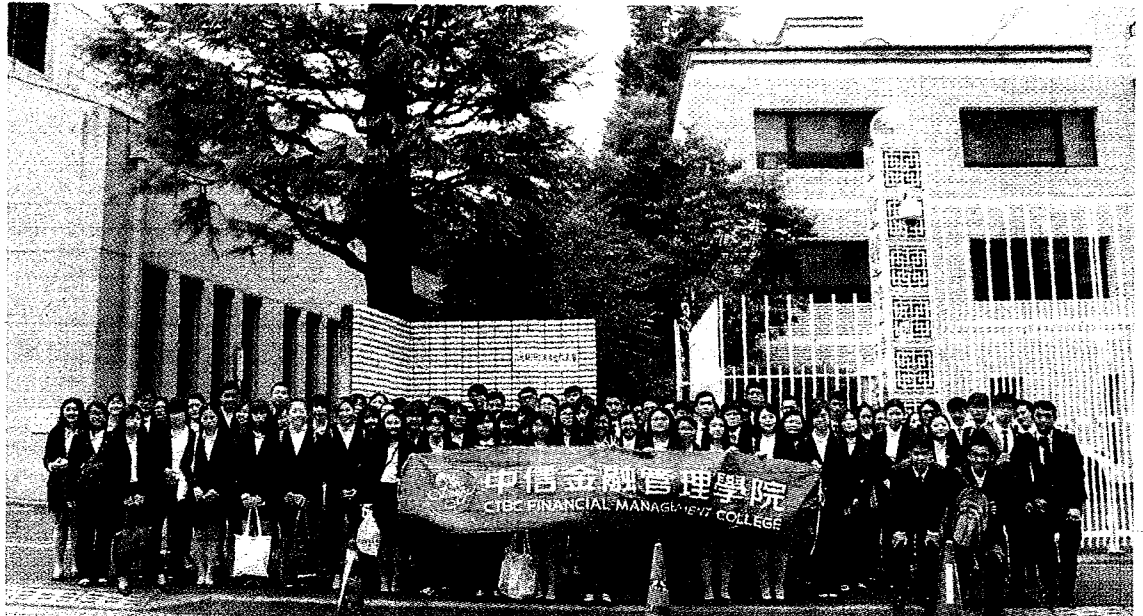
在參訪駐日代表處後，中金院的日本研習學生在代表處前合照。