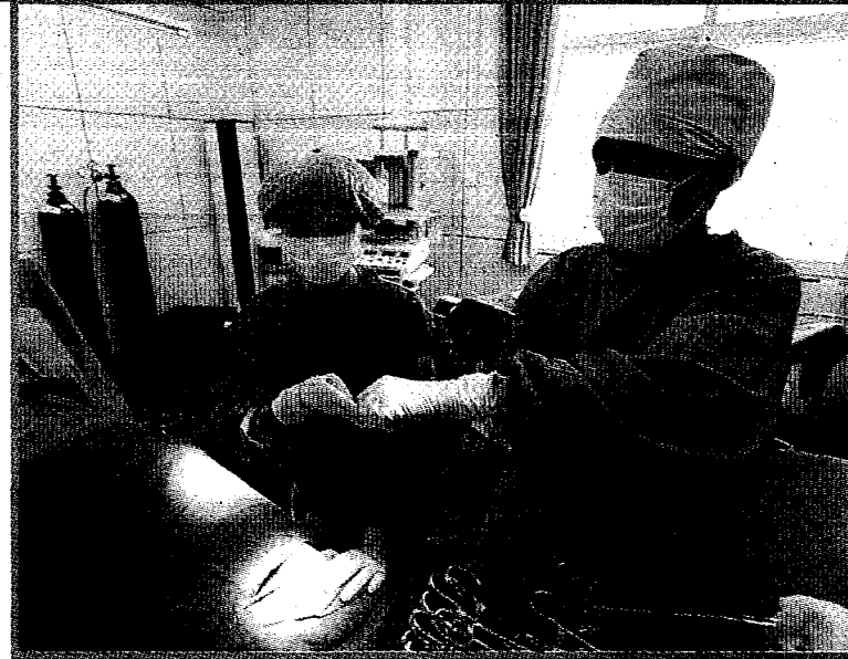
▲曾就讀廣西幼兒師範學校的幼兒園老師，示範拍籃動作。