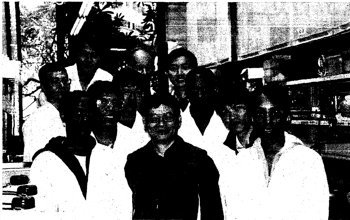
菲律賓政府更改學制後，教育部預估往後來台就讀大學的人數可能增加，圖為外籍生比率最高的台灣科技大學。