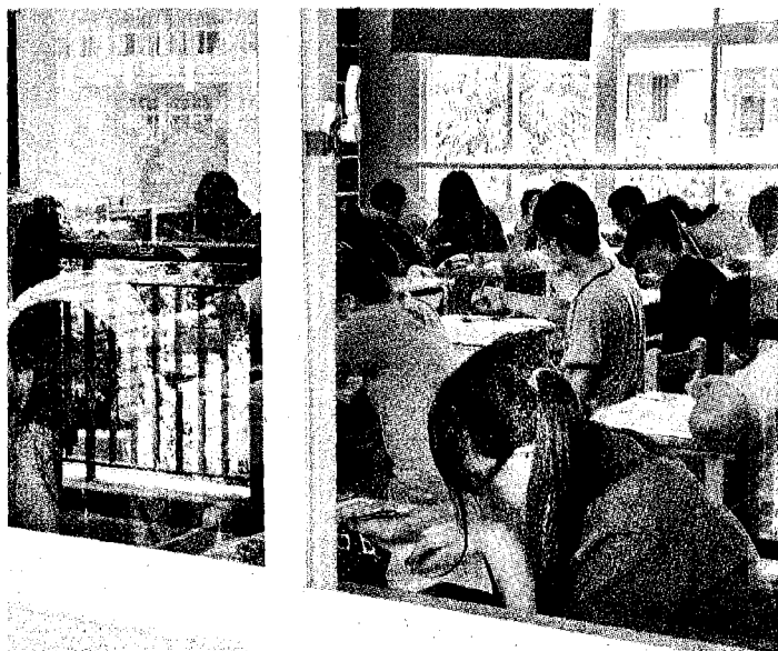
明年將開辦五專優先免試入學，提供5600個名額試辦。 圖為去年國中會考現場。