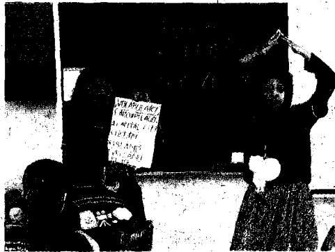
台科大外籍生到高雄美濃舉辦夏令營。

【記者曹麗蕙台北報導】來自印尼、越南、韓國、美國的台灣科技大學外籍生，暑假南下至高雄美濃龍肚國中舉辦夏令營，不僅用英文介紹母國的地理、節慶、食物、音樂舞蹈、童話故事，增進偏鄉學生的英語能力，課程也將美濃的藍染、客家料理等在地文化特色融入，讓學生反思家鄉文化的重要。