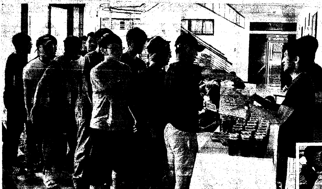
↑靜宜大學生態系出租玻璃環保杯，每天有超過5成出租率。

靜宜大學▶綠杯子計畫減少600個以上塑膠杯 內埔國小▶心疼海龜鼻子插吸管 吸管1周少8成