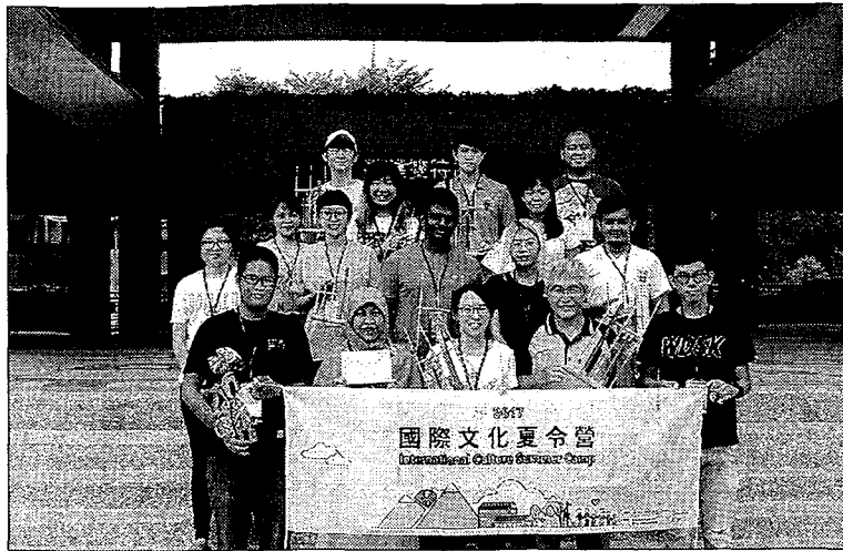
雲科大「二〇一七國際文化夏令營」五國十二位學生志工傳愛草嶺合照。(記者劉春生攝)