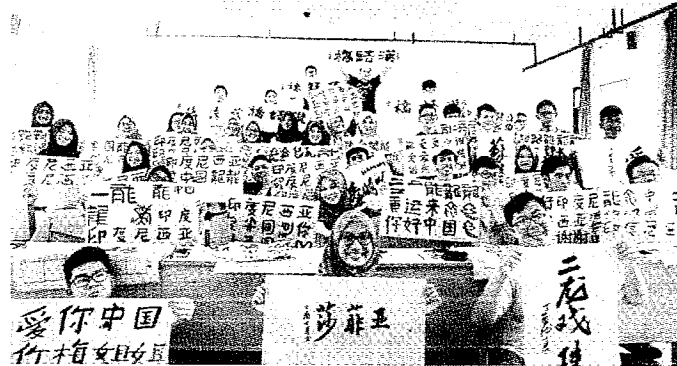
▲7月29日，東協國家學生和自己的書法作品合影留念。

今年適逢東協成立50周年，也是「中國——東協教育交流周」舉辦10周年，以「十年教育同攜手，『一帶一路』譜新篇」為主題，本屆大會中國與東協簽署通過《貴陽共識》，雙方將積極支持參與各類職業技術教育領域的活動，並推動落實「中國——東協雙百職校強強合作旗艦計畫」。