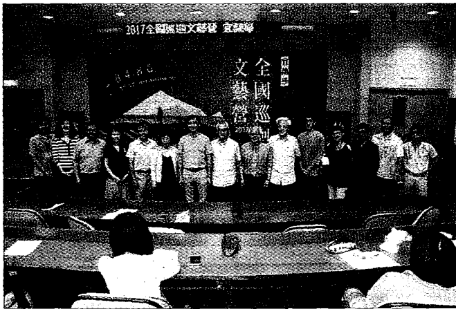
●2017全國巡迴文藝營，8月4日至6日在宜蘭佛光大學舉行，全體師資合影。

2017全國巡迴文藝營，8月4日至6日在宜蘭佛光大學登場，這也是全國巡迴文藝營連續第四年在佛光大學舉行。