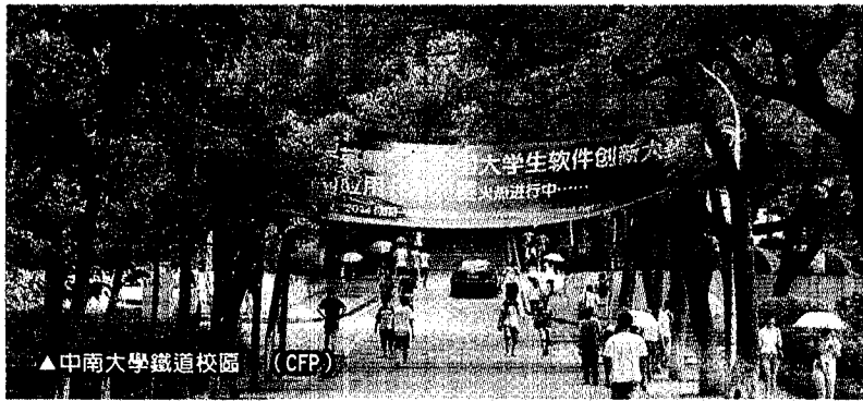
▲中南大學鐵道校區

像她自己個性比較積極，小組分工她會設下時間表一個個去盯，久而久之就變成小組長；小組成員有來自印尼、法國、台灣和大陸，可能一開始專業知識不足，但都懂得分頭去找資料，讓自己快速學習，真正上台報告也是有模有樣。