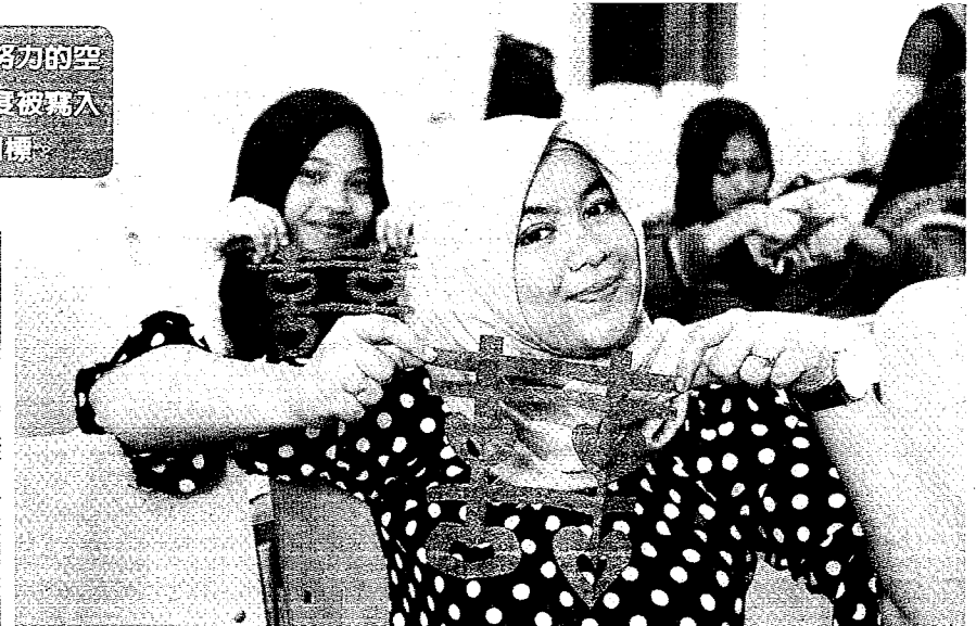
▲7月29日，兩名東協同學展示自己的剪紙作品。