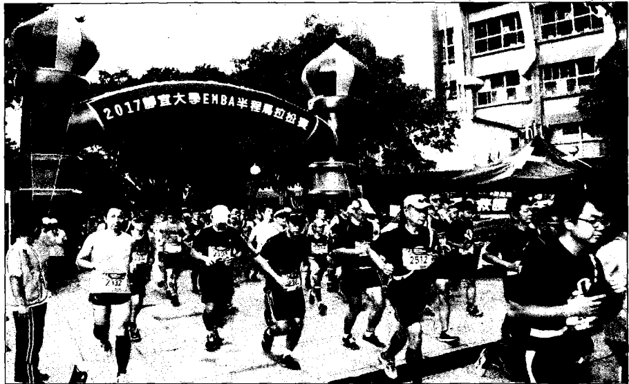
→ 靜宜大學EMBA校友會主辦的「靜宜大學EMBA半程馬拉松」，吸引全國超過二千名愛好路跑民衆參加，體驗大肚山之美。 (記者陳金龍攝)