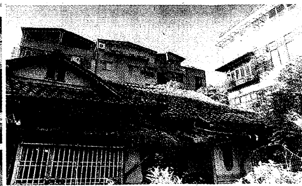
溫州街日式老屋（小圖，資料照）被台大拆成廢墟（大圖）。