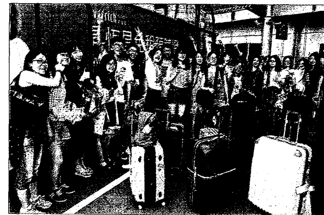
陸生未來可用支付工具繳納來台學費。圖為在台陸生。 （本報系資料庫）

明顯感受的這股趨勢，因應支付型態的轉變，台新銀行去年起即與螞蟻金融服務集團合作，開辦支付寶跨境交易，已布建包含機場免稅店、百貨公司、計程車隊、景點民宿及各大夜市商圈等超過28,000個收款點。