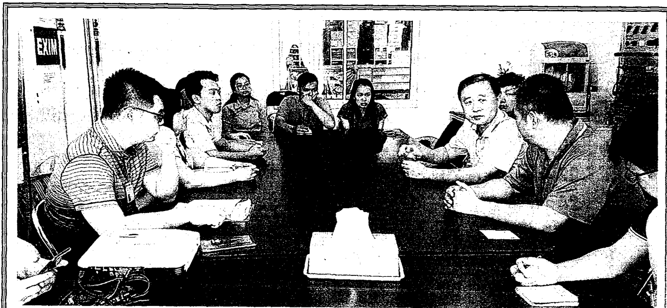
台首大用心經營印尼偏鄉，畢業生肯定四年所學「值得」。