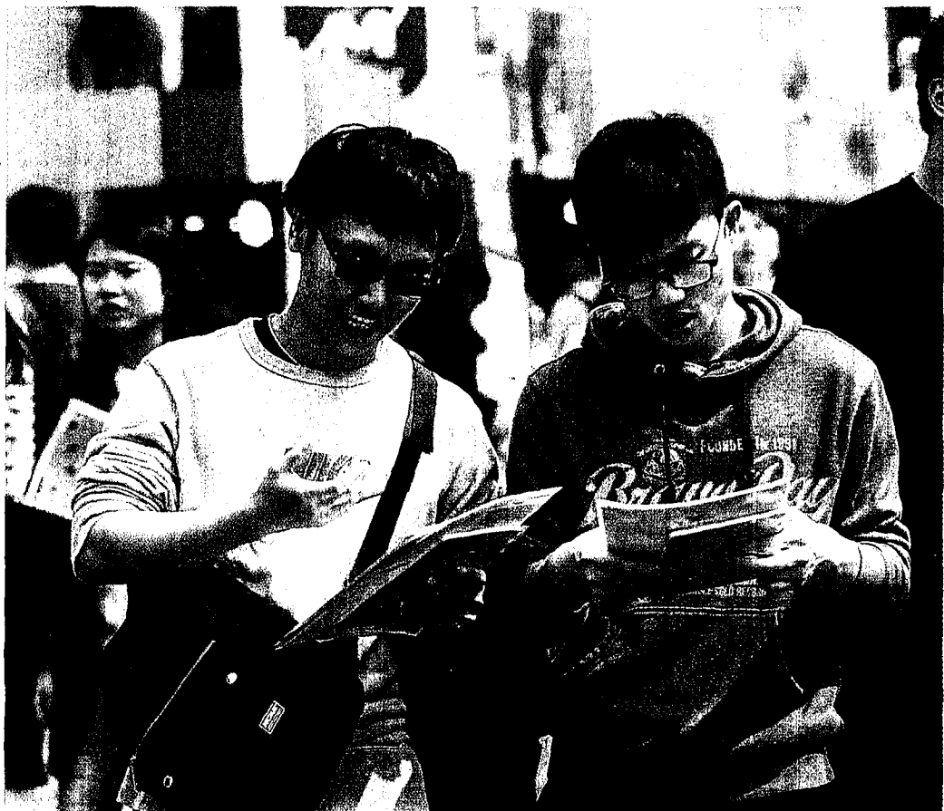
聯合報 A14 版