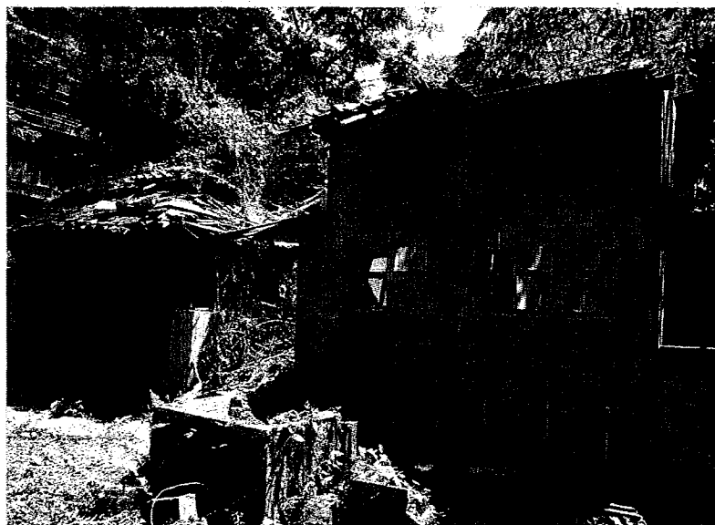
位在潮州街9號的日式宿舍，曾是總督府教育廳長寓所，由於年久失修，房屋毀損嚴重，屋頂還長出植栽。（陳燕珩攝）

台大表示，9月中改善期限前會做好室內外的環境清理，針對潮州街宿舍會提送緊急加固計畫，做局部的棚架支撐，這2處已進入促參程序，通過中央審核後，近期會積極對外招商。