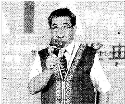
第四屆「MATA獎」由蔡政務次長清華親自主持頒獎典禮。

【記者王志誠、周貞伶／台北報導】教育部為推展原住民族教育，深化大專校院學生對原住民族歷史文化的了解、尊重與認同，辦理第四屆「MATA獎」——106年大專校院學生原住民族文化特色數位影音競賽活動，評選出14件優秀的入圍作品（共六十二位同學）。