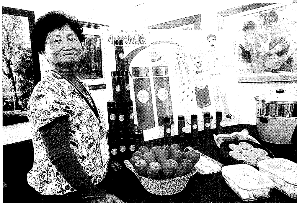
「將軍出策、尋農趣」智慧農鄉田野調查工作坊，展示成果。

工作坊除了讓學生能夠有成長的空間，也能讓各界深入了解本土特色，並為在地文化注入不同的風貌，呈現不一樣的農鄉風情。