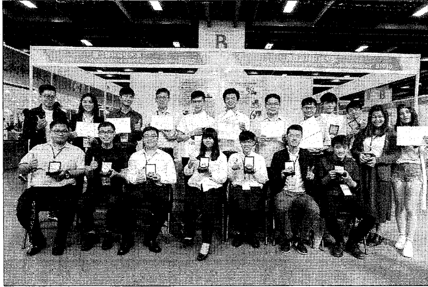
雲科大師生創意研發 台北國際發明展大放異彩。