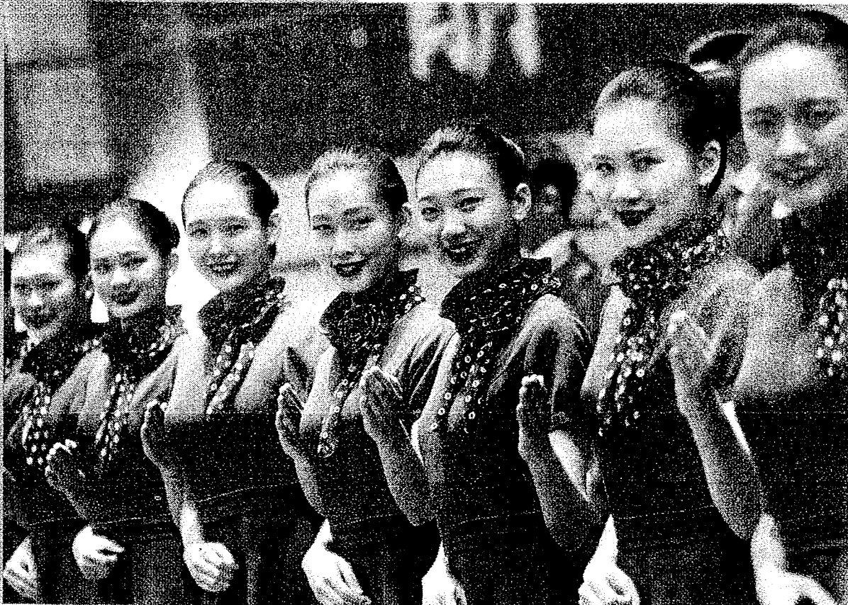
銘傳大學連續33年擔任國慶典禮的禮賓接待任務，30位學生亮相，女性禮賓服採用大紅色上衣，搭配鐵灰色的小圓裙以及銘傳校徽的花朵領巾。(右圖)