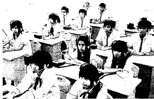
大學招生採計高中英聽測驗的校系逐年減少。資料照片

大學招聯會自103學年起開放各校系自由採計大考中心舉辦的高中英聽測驗，成績由高至低分為A、B、C、F四級，繁星、申請、考試分發等3