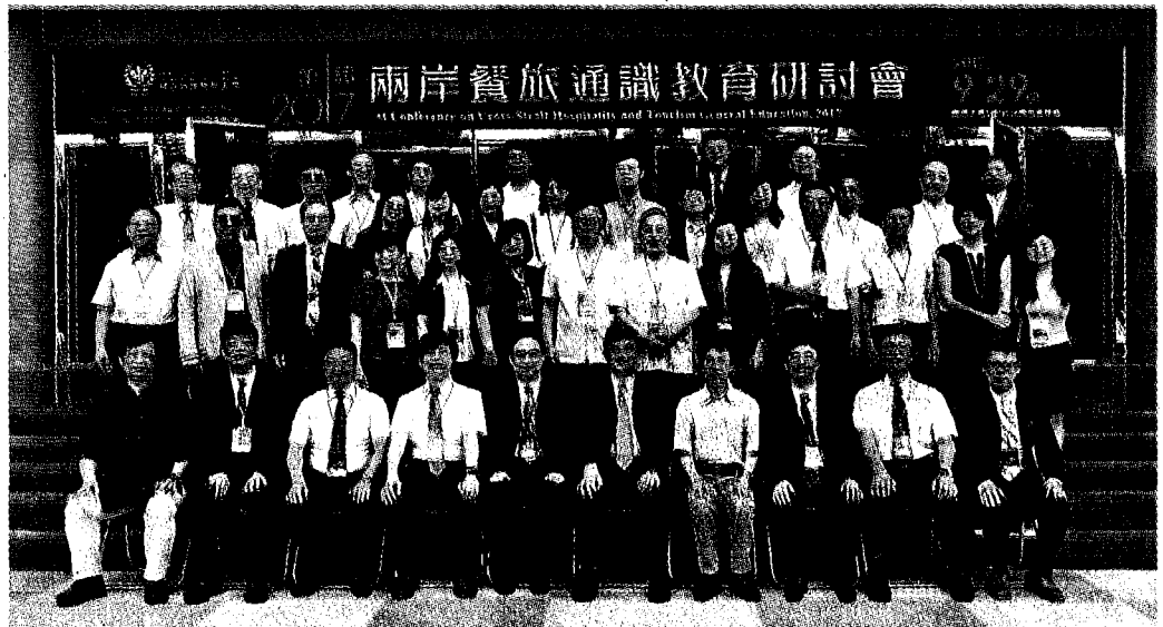
高餐辦首屆兩岸餐旅通識教育交流，濟濟多士，學術能量大。