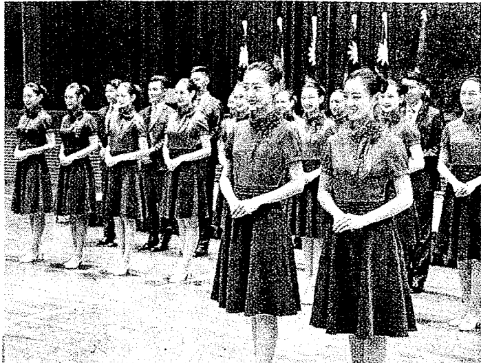
銘傳大學國慶親善服務隊在台北亮相，今年選出24名同學擔任禮賓人員，將在國慶典禮上擔任指引及接待工作。(上圖)