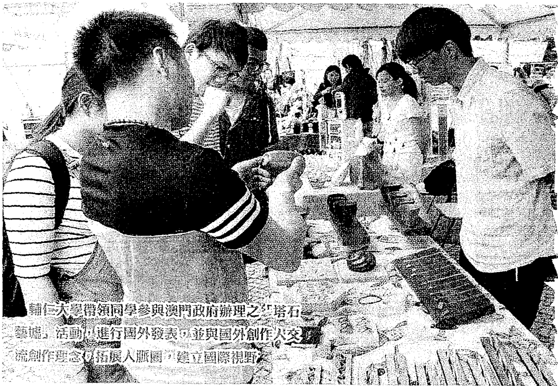
輔仁大學帶領同學參與澳門政府辦理之「塔石藝墟」活動，進行國外發表，並與國外創作人交流創作理念以拓展人脈圈，建立國際視野。