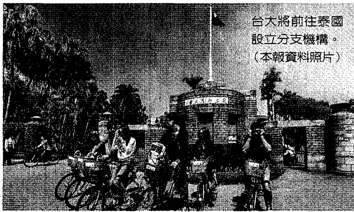
台大將前往泰國 設立分支機構。