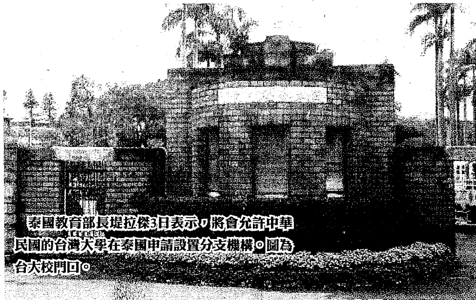
泰國教育部長堤拉傑3日表示，將會允許中華民國的台灣大學在泰國申請設置分支機構。圖為台大校門回。

堤拉傑指出，泰國政府全力推動泰國「O」計畫，為培養更多未來產業升級所需人才，泰國政府將會放寬規定。