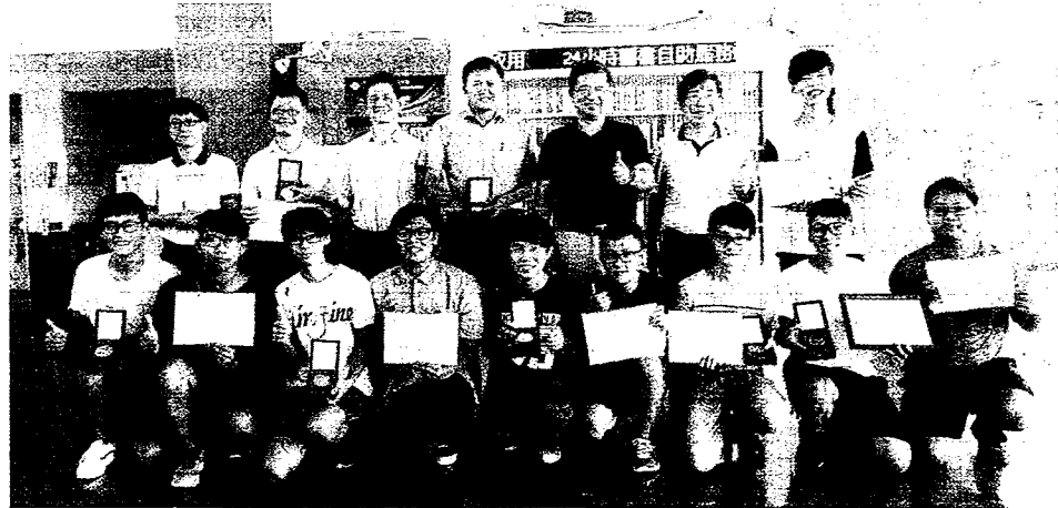
國立高雄應用科技大學參加2017台北國際發明暨技術交易展，7件作品參展，全數獲獎，榮獲2金2銀3銅的亮眼成績。

持下，積極鼓勵各系所師生參與國內外競賽，吸取更多的專業領域知識與評委給予的意見，透過實際的競賽及意見回饋，落實及強化研發