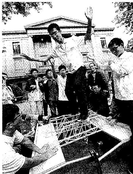
▲南京東南大學土木工程學院學生站在用50根細木條製作的橋梁結構模型上，展示模型的承重能力。