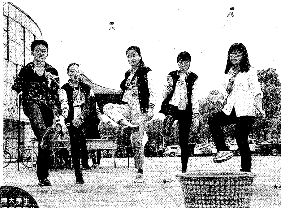
▲4月20日，東南大學學生在健康文化節活動現場參加踢毽子入筐遊戲。