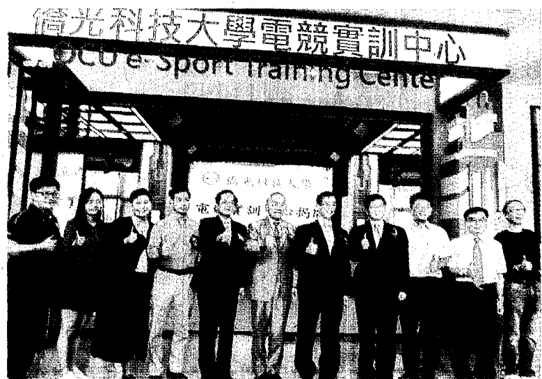
僑光科技大學昨天舉辦校慶系列活動，斥資三千多萬元打造的全國第一座電競實訓中心也舉行揭牌啓用典禮。

僑光科大指出，為呼應政府推動的新南向政策，該校新南向中心與高鐵工業股份有限公司聯合向印尼地區招攬工具機專業人才，並成立「工具機整合設計國際產學合作專班」，該班除獲教育部全額補助經費之外，也在校慶當天舉行始業式。