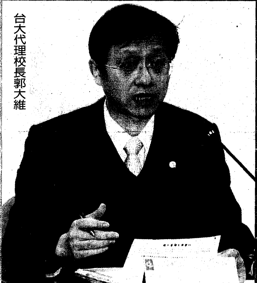
台大代理校長郭大維