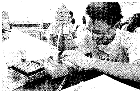
▶天津大學系統生物工程教育部重點實驗室進行實驗。