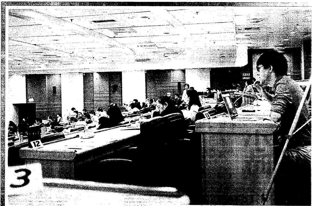
台灣大學昨天召開校務會議，學生會代表在會場內架設器材，打算全程「網路直播」，但遭到投票否決。（中央社）

校外委員中互推一人，暫行倫理委員會主任委員的職權，校務會議代表並可推派一到三人列席。另外在選任調查小組時，必須指派校外學者專家擔任召集人，並增派被檢舉人所屬學院專任教授一人擔任共同召集人。 一般來說，學術倫理委員會的主任委員是學術副校長，但副校長是校長選派。如果校長涉案要接受調查，按照台大新作法，必須由校外委員暫行倫理委員會主委的職權，以避免爭議。