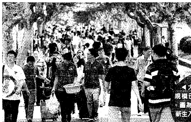
◀大陸大學生規模已超越專科生。圖為大理理工大學新生入學報到。（新華社）

大陸教育部高等教育教學評估中心日前發布，最新版中國高等教育系列品質報告，除首度提出的《中國本科（四年制大學）教育質量報告》、《中國民辦本科教育質量報告》外，也強調大陸已成為名副其實的高等教育大國外，並展望2030年如何建設中國特色、世界水平的一流高等教育。