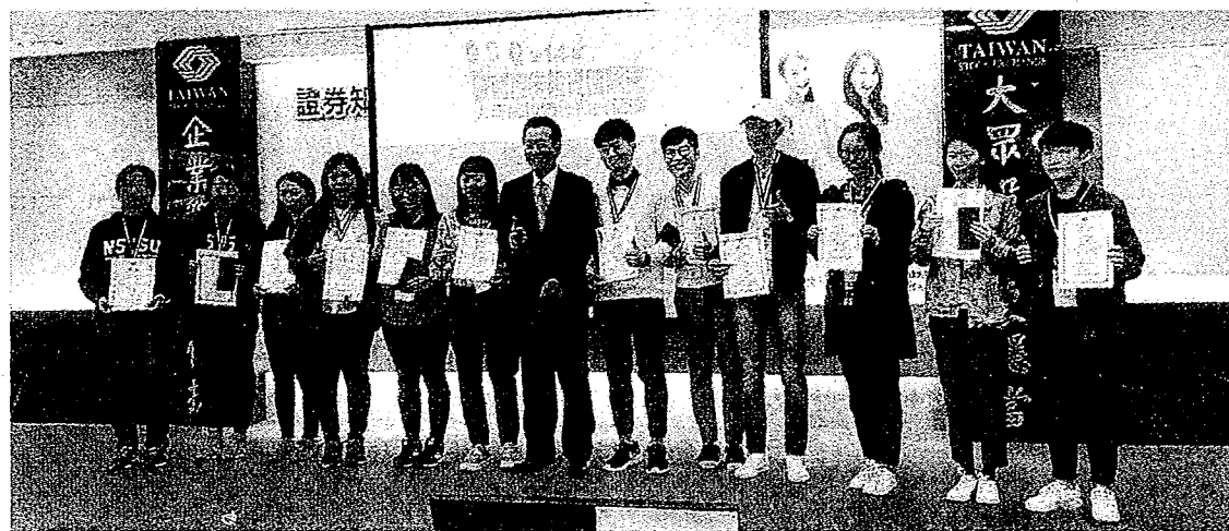
金管會顧立雄主委頒獎給中國科大財金系同學。

活動辦理以來，已成為國內大學院校年度競賽盛事之一。進入複決賽的三十二隊，是由全國總參賽一,七七九隊五,三三七位同學中經歷三天網路初賽後脫穎而出，財金系同學在12月下旬的總決賽中並獲得第三名成績，實屬難得