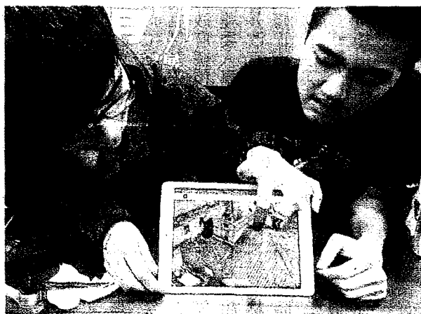
富岡老街一磚一瓦影像都在裝置上呈現。