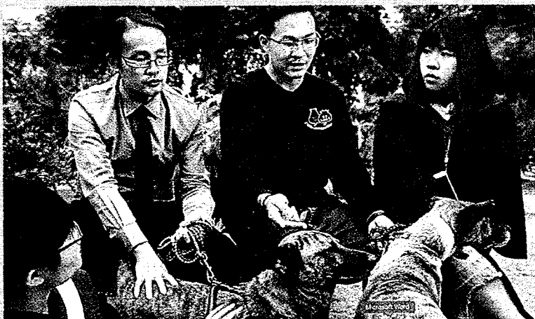
世新公廣系學生採訪台南市動物愛護協會人員，探討流浪動物問題。