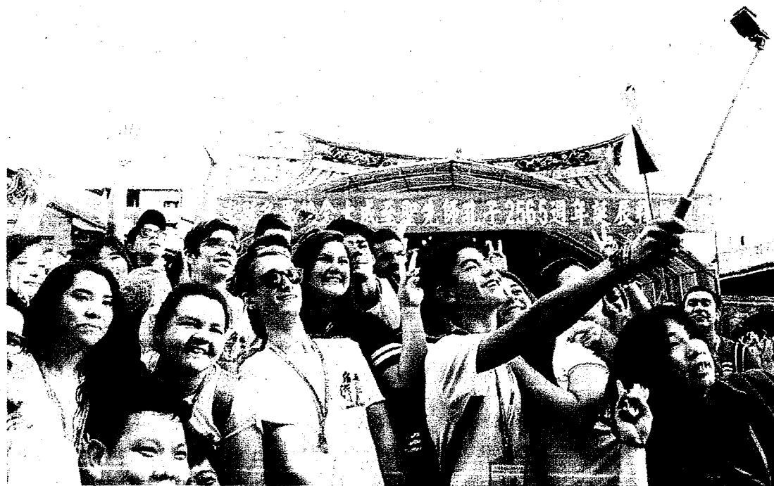
受到少子化衝擊，私立大學近年來積極開闢生源，招收境外生人數比國立頂尖大學更高。

師發表論文數及影響係數等，目前已有16校通過第一階段篩選門檻，這些境外生人數多的私校都不在其中，第二輪將由校方進行簡報，結果預計1月下旬出爐。