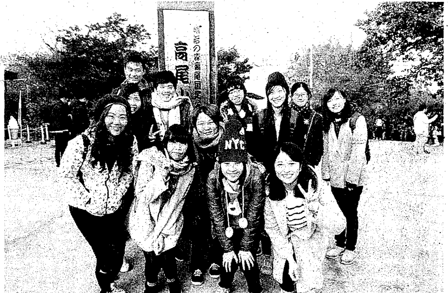
大葉大學應日系每年都有許多學生赴日本留學。