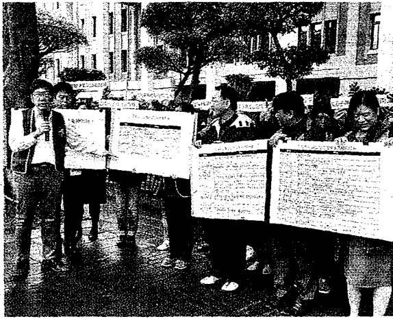
自由時報 A3 版

招聯會表示，甄試撞期是長久存在的問題，今年以四月十四日黃金週六撞期最嚴重，協調後衝堂的校系數減少，從去年四百九十個減為四百五十六個校系，只限定四月十四日一天甄選的校系也從二百九十一個降為二百五十九個，招聯會將繼續努力協調各大學，最慢一月中下旬再加開會議討論。