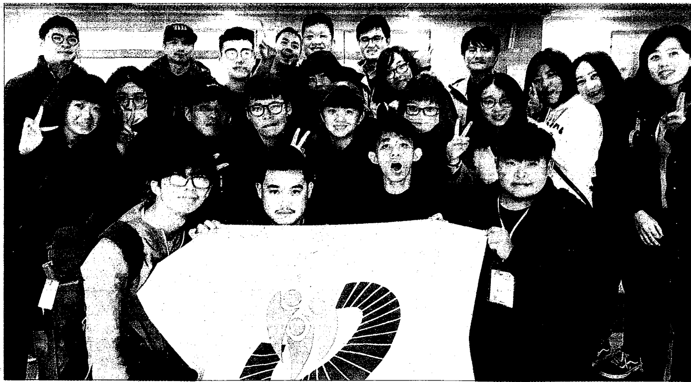
←崑大公廣系學生團隊執行產學合作，為伺服器機殼大廠勤誠興業完成中國大陸上海、蘇州等地工廠年度優良員工紀錄片拍攝任務。