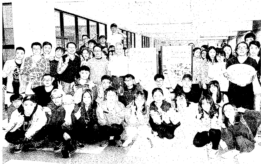
大葉大學生科系舉辦食品加工實習期末成果展。

【本報記者廖慶龍大村報導】大葉大學生物產業科技學系「食品加工實習」課程舉辦期末成果展，展出大三學生親手做的香腸、麵筋罐頭、蜜餞、蛋捲、餅乾、冰棒、冰淇淋、天婦羅、肉包等食品。學生們開心地說，自己做的食品完全沒有化學添加劑，寒假回家要把上課學到的安心食品做給爸爸媽媽吃。