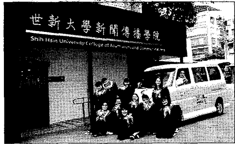
世新公廣系畢籌團隊去年底展開一場「善」自主張的旅行，大學生環島揭善最終回。

【記者王志誠、周貞伶／台北報導】世新公廣系畢籌團隊去年底展開一場「善」自主張的旅行，秉持發揮傳播力量的初衷，環島七天訪問位於七個鄉鎮的七位善心人士，並於畢業展粉絲專頁經營一系列直播節目，最後在二〇一八年元旦畫下句