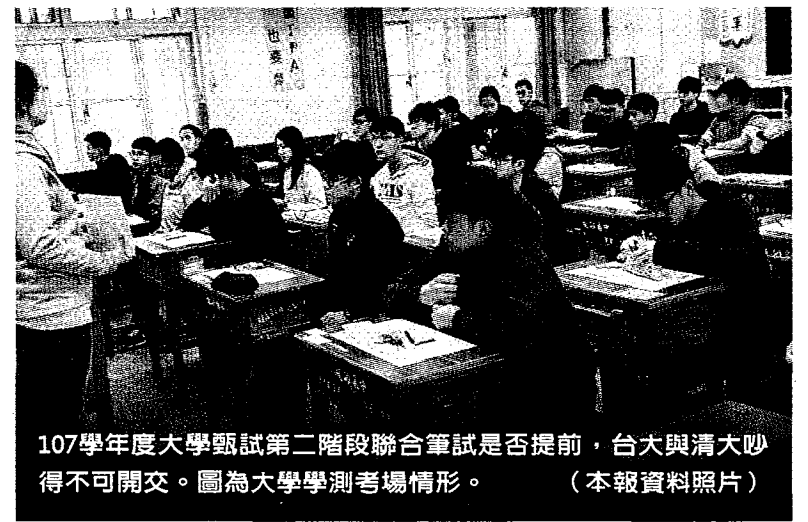
107學年度大學甄試第二階段聯合筆試是否提前，台大與清大吵得不可開交。圖為大學學測考場情形。（本報資料照片）

過去半年來，清大和台大為了考招制度「互動」頻繁，但兩校早在2015年8月1日，台大把自從招聯會成立後，掌控長達6屆、18年的招聯會召集人頭銜讓給清大校長賀陳弘之後，就已結下梁子。今年台大提前二階聯合筆試是否成案，各界都在看。