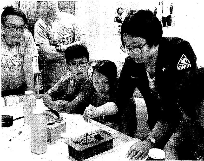
↑台南應大回皂創業團隊到學校教導手工皂製作方式，也宣導回鍋油傾倒水管對環境造成的污染與危害。