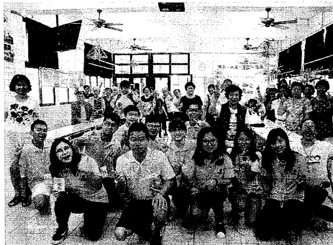
中原大學環工系在竹霄社區成立關懷據點與民眾宣導低碳社區。

【本報記者任青莉台北報導】中原大學昨日表示，該校與周邊的八德竹霄社區合作，以「樂齡福祉、食養社造、設計創業」為目標，結合建築、室設、商設、景觀、環工、應華、文創所等七個系所的專業為地方注入活力。室設系學生結合霄裡稻田之美打造稻草人路標、用發光石重現「石母娘娘」傳說；建築系學生製作歷史人文桌遊「竹霄棋」。該校師生發揮大學社會責任，為地方帶來新的改變與未來！