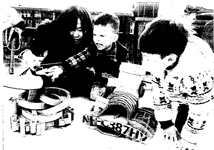
↓中原大學景觀系同學穿著青蛙裝，清理霄裡國小旁的埤塘。