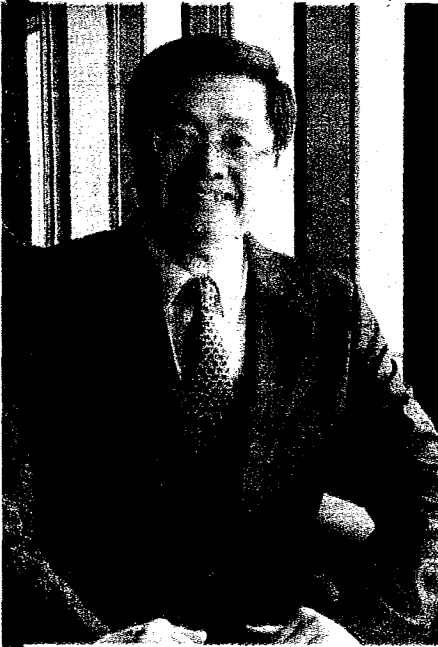
高醫第八任校長當選人鐘育志教授。