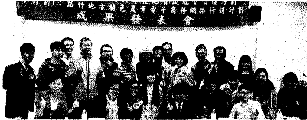
高苑科技大學商管學院行銷與流通管理系舉辦大學社會責任實踐計畫一路竹地區特色農業電子商務網路行銷子計畫成果發表會，以善盡大學社會責任。

【本報記者黃守作高雄報導】高苑科技大學商管學院行銷與流通管理系於昨天上午，在該系舉辦大學社會責任實踐計畫一路竹地區特色農業電子商務網路行銷子計畫成果發表會，以善盡大學社會責任。