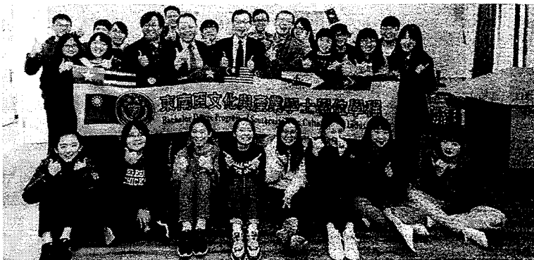
長榮大學東南亞海外行動學習啓程者。

【本報記者黃緒勳台南報導】長榮大學東南亞文化與產業學士學位學程舉辦行前會議，校長李泳龍勉勵年輕學子踏出台灣，走出獨特的海外行動學習模式。