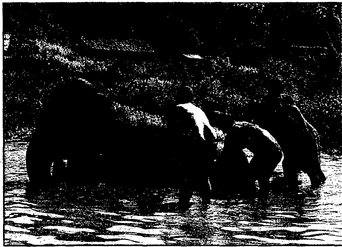
朝陽科技大學補助學生進行海外體驗學習，圖為學生們幫大象洗澡。