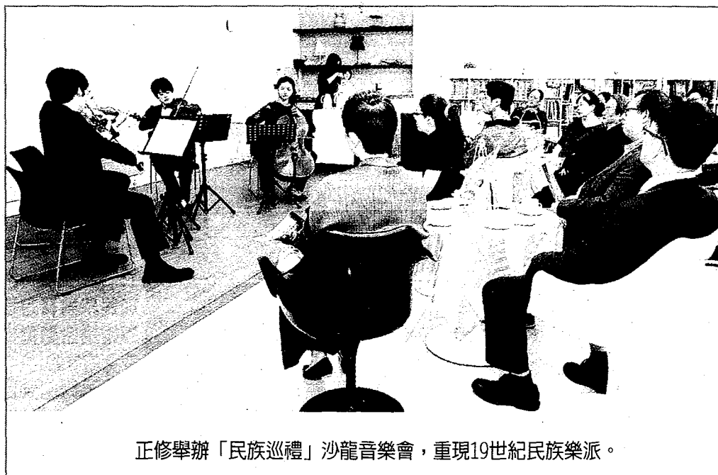
正修舉辦「民族巡禮」沙龍音樂會，重現19世紀民族樂派。