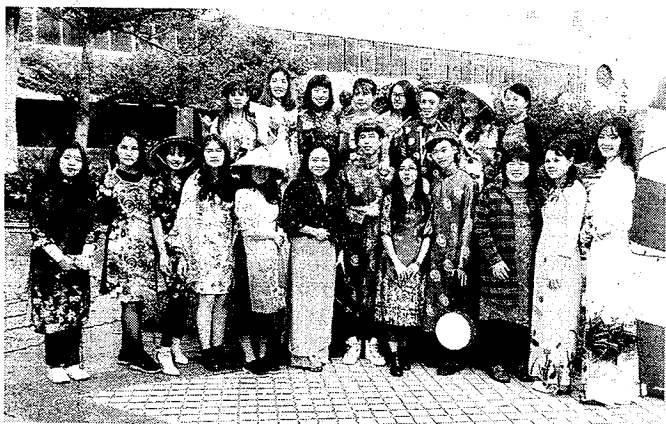
龍華科大應外系舉辦越南文化節，學子體驗越南傳統服飾，校園洋溢濃濃異國風情。

，看準東協經濟體崛起，考量業界人力需求趨勢，許多台商急需精通東南亞語言人才，該系在104學年度下學期開設越南語課程，藉以培養同學的外語能力，並強化就業優勢。由於學校長年和越南多所大學合作，因此擁有一些越南籍學生，在校園中更有許多機會能夠實地練習越南語。