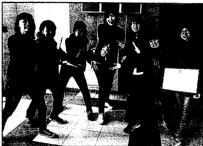
牛頭牌沙茶醬 60 週年慶微電影競賽，大葉視傳系學生獲銅牌佳績。