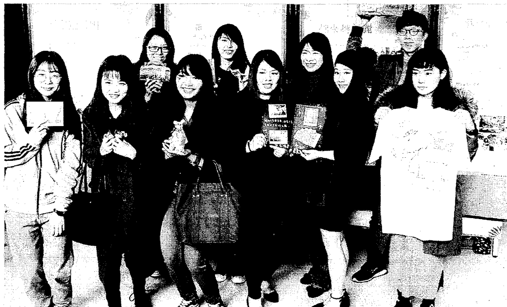
朝陽科大30位學生壯遊全球15國，昨日起至19日於該校圖書館大廳辦理成果發表會。

朝陽科大人文暨社會學院院長徐志輝表示，為了讓增強學子的國際觀，特別開設青年海外體驗學習