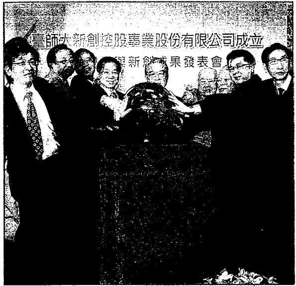
率國內大學之先，台師大成立新創控股事業股份有限公司正式啟動。