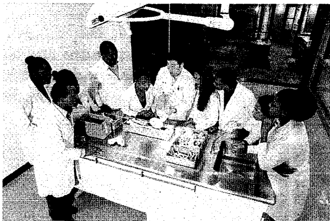
▲義守大學擔任外交先鋒，成立學士後醫學系外國學生專班，協助邦交國培育醫療人才。

為協助政府培育友邦醫療人才，義守大學領先全台，首開「學士後醫學系（外國學生專班）」，專門招收來自邦交國的外籍生，課程採全英語教學，去年已有32名第一屆畢業生，相繼返回母國，從事醫療相關工作，代表台灣醫療已走向國際化，並協助邦交國發展醫療產業與醫學教育。