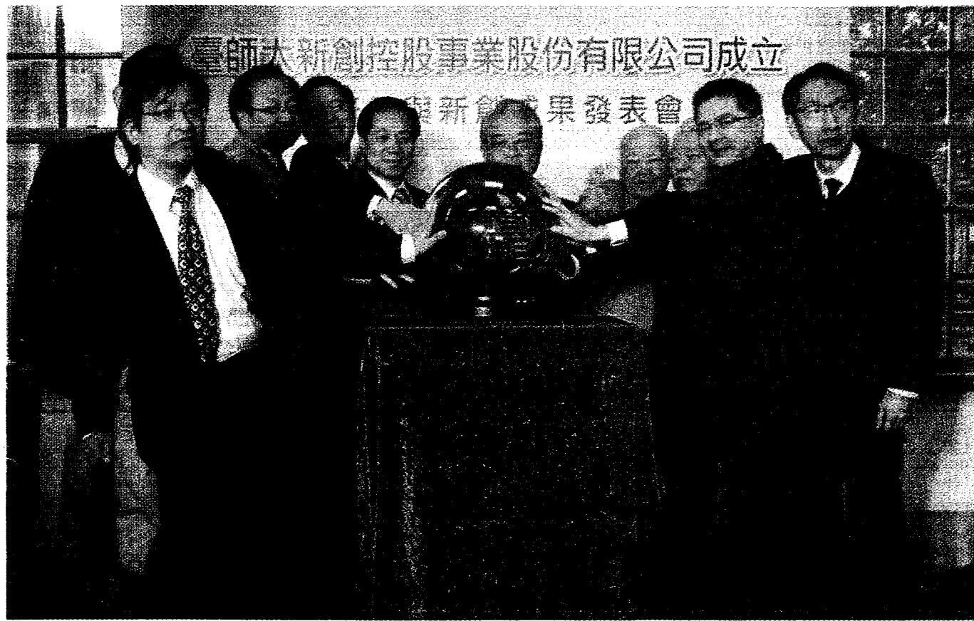
臺灣師範大學昨日成立國內大學第一家產學合資投資控股公司「臺師大新創控股事業股份有限公司」。

由金仁寶集團董事長擔任控股公司董事長 以提供學生學習未來就業技能 縮短所謂產學落差