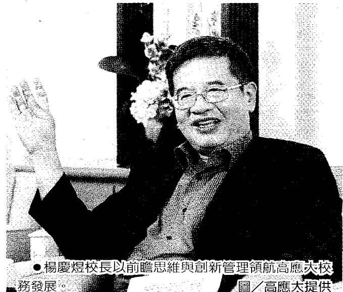
●楊慶煜校長以前瞻思維與創新管理領航高應大校務發展。

答：高雄3所科大合一後，將為全國學生數最多、規模最大的科技大學，預期可達成教學資源及師資整合、產研績效提升及多元展現、學生學習資源增加、行政系統及效率提升、各校區特色建立及空間整合與利用效能提升，並整合不同領域科技