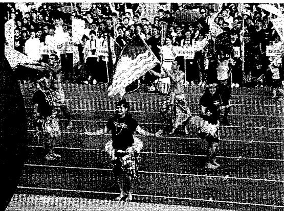
▲義守大學積極發展國際化。圖為義守大學醫學院外籍生表演草裙舞。

產業發展，偏好美國模式，但是在大學學費管制上，卻由教育部統一管轄，並非如美國回歸市場彈性機制，「我常在說，LV的包包要價上萬塊，仍有人願意消費」，若以此方式討論大學學費，邏輯相當，「不用擔心學費調漲，就沒有學生來念，大家重視的是辦學品質，辦不好才會招不到學生」，他說。