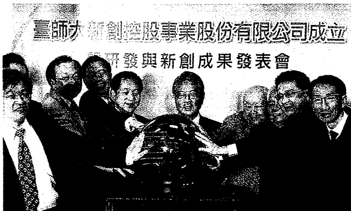
上圖：台師大成立新創控股公司，並找校友金仁寶集團董事長許勝雄（中）擔任董座，盼扶植出台版「獨角獸企業」。