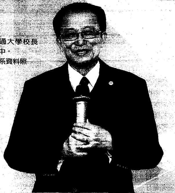
交通大學校長 張懋中。

他認為，必須從教育做根本改變，將來台灣才有可能出現先驅者或領導人，而不是像現在頭痛醫頭、腳痛醫腳，一間大學要做所有事，大學應該要分類。