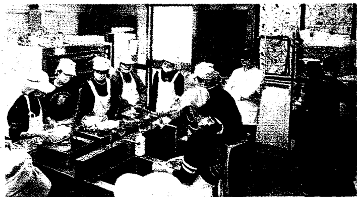
↑嘉南藥理大學保健營養系四年級學生利用課餘時間幫養護機構長者製作膳食。