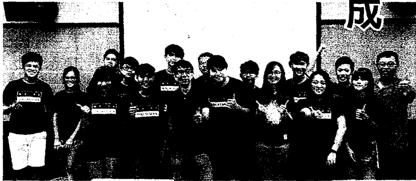
↑崑大協助異鄉學子成立「馬來西亞同學會」社團，號召同鄉加入，一年來透過各項活動增進情誼，並與台生交流飲食文化。

社團更會特別舉辦「馬國文化展覽」，邀請全校師生一起了解大馬的旅遊及飲食文化，介紹麻六甲市的教堂、博物館、鐘樓等觀光景點的旅遊規劃，以及利用班蘭葉和椰漿烹煮的椰漿飯等家鄉菜品嘗分享。