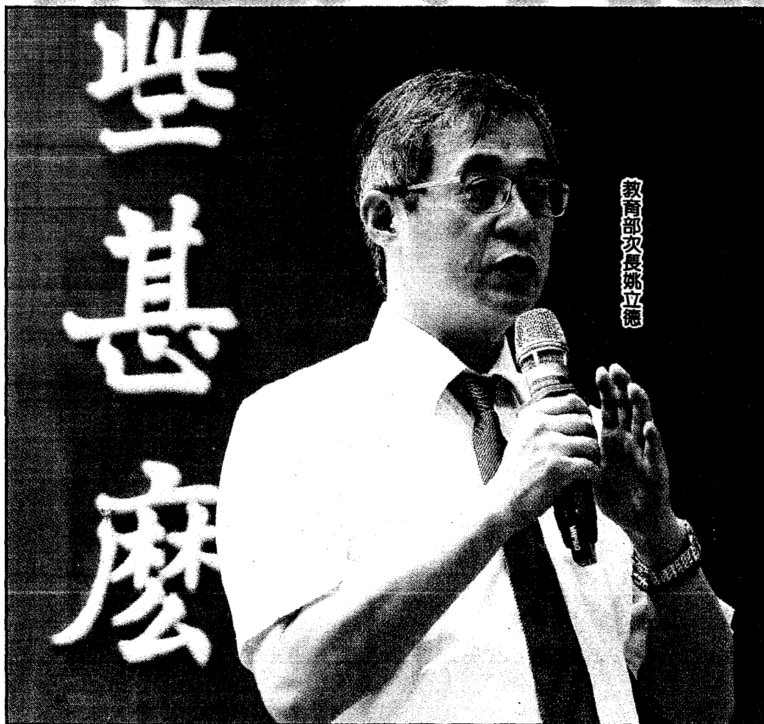
教育部次長姚立德

【台南訊】教育部次長姚立德表示，只要大學願額外提供教師彈性薪資，教育部將幫忙分攤增加的彈薪支出，而大學為弱勢生募款，教育部也將提供同樣經費的補助。