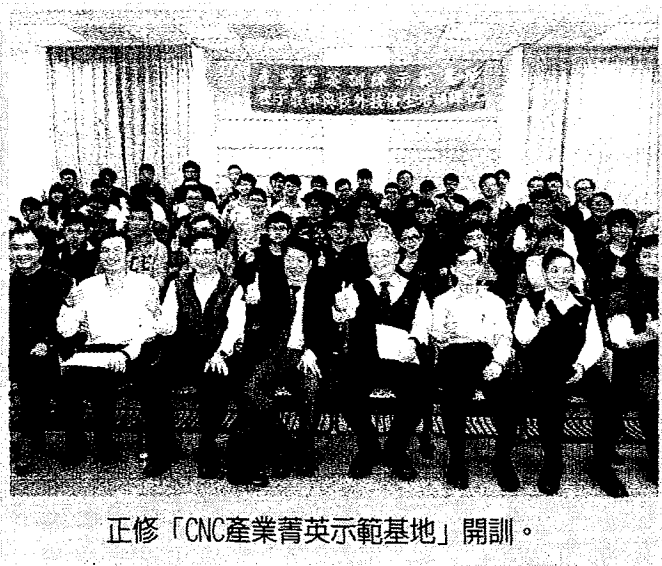
正修「CNC產業菁英示範基地」開訓。