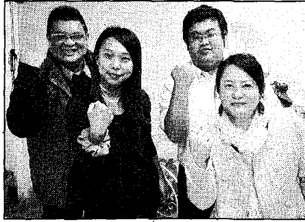
大葉大學藥保系所學的中醫經絡與芳香療法專業，讓他們獲凡妮莎國際美容青睞，錄取為實習生。