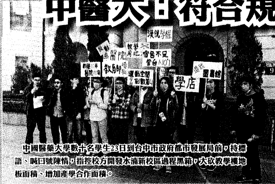
中國醫藥大學數十名學生23日到台中市政府都市發展局前，持標語、喊口號陳情，指控校方開發水湳新校區過程黑箱，大砍教學樓地板面積、增加產學合作面積。

【台中訊】中國醫藥大學數十名學生，昨天到台中市政府都發局前陳情，指控校方開發水湳新校區過程黑箱，大砍教學樓地板面積、增加產學合作面積。校方聲明，過程均符合規定。