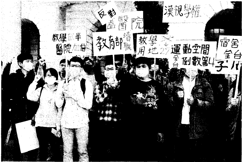
↑中國醫藥大學學生到台中市府都發局陳請，憂心水滸新校區淪為醫療、生技產業園區，質疑校方用地規劃。

議、董事會合法程序通過，向教育部提出的購地計畫書就有提到「但書」，計畫內容會隨中、彰、投發展、因時間調整，購地計畫在一○一年經教育部、行政院核准通過，沒有所謂低價購地的問題。