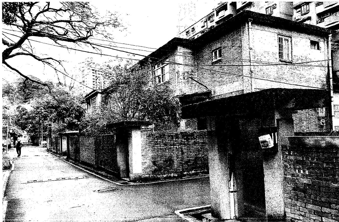
政大教師宿舍化南新村改建案，文化局昨召開文資審議會，決議登錄為「聚落建築群」。