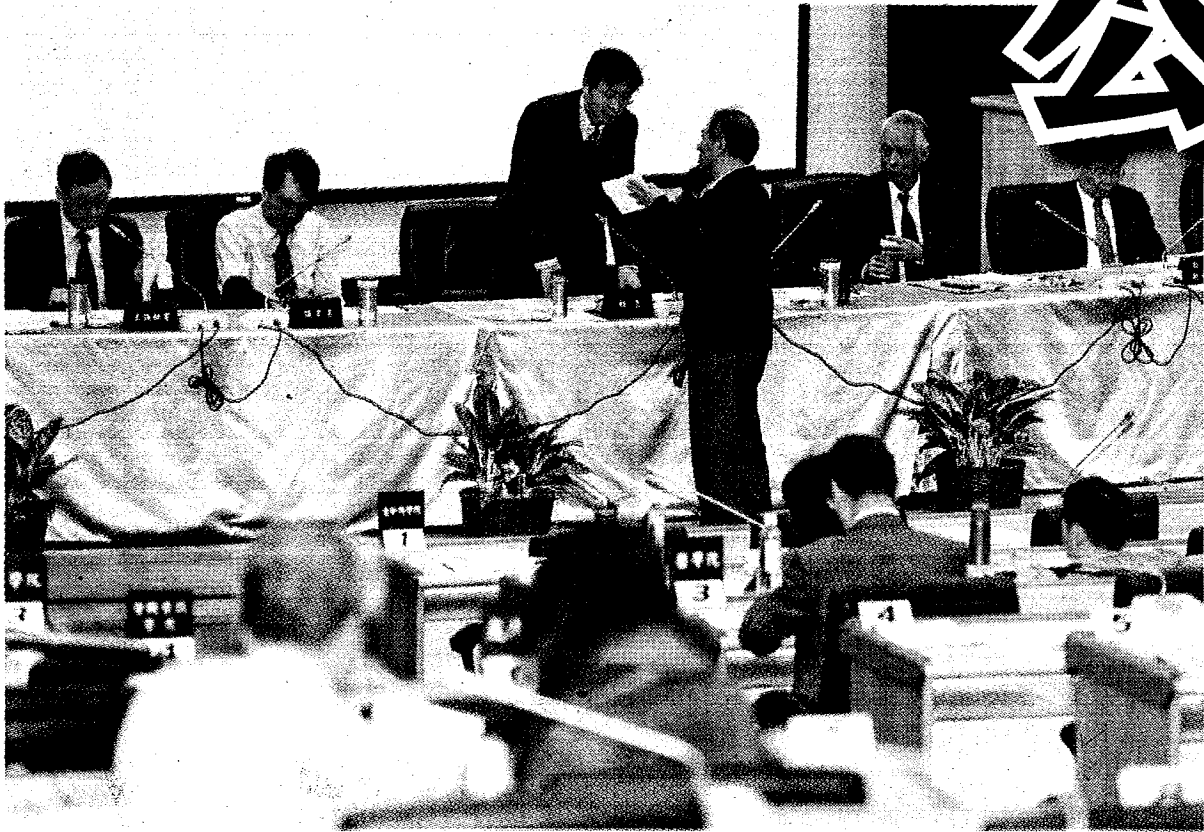
台灣大學24日上午召開臨時校務會議，討論校長遴選相關爭議。

【台北訊】台大校長遴選風波，台大召開校務會議，經表決「成立本校校長遴選爭議調查小組案」等5個提案全數擱置。教育部表示，待台大公布會議紀錄後，會盡速做後續處理。