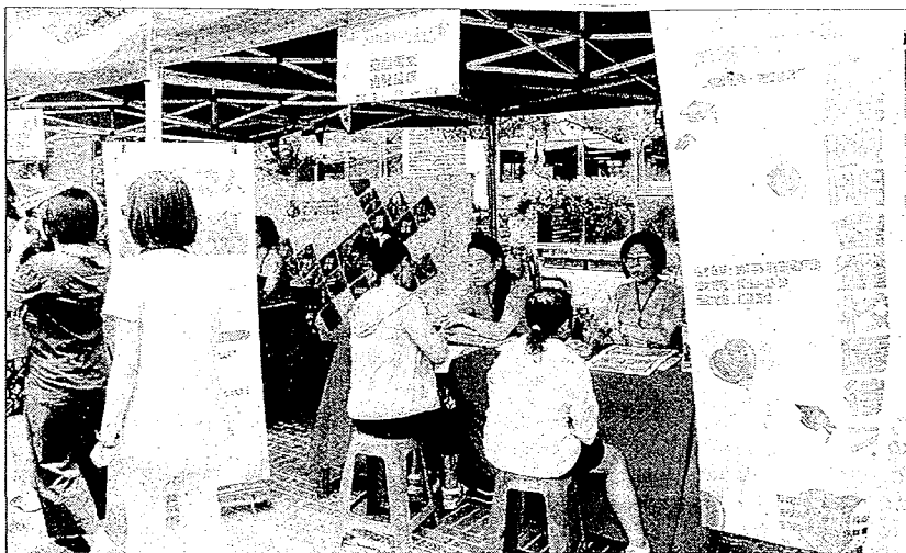
朝陽科大舉辦「掌握趨勢、洞燭機先—2018企業說明會暨校園徵才」活動。