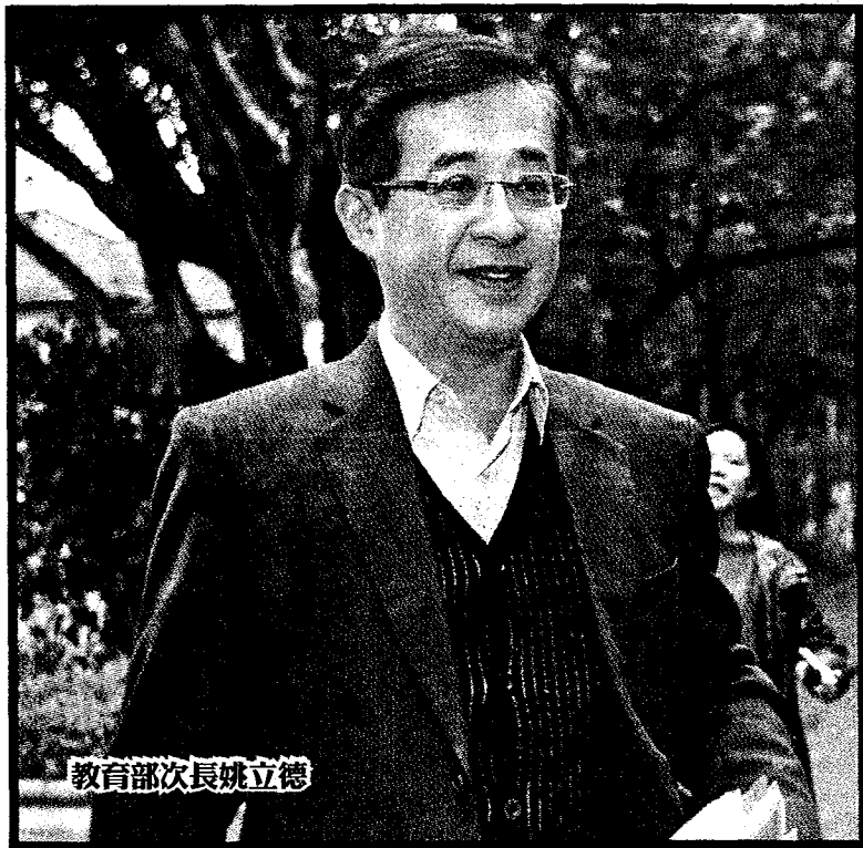
教育部次長姚立德