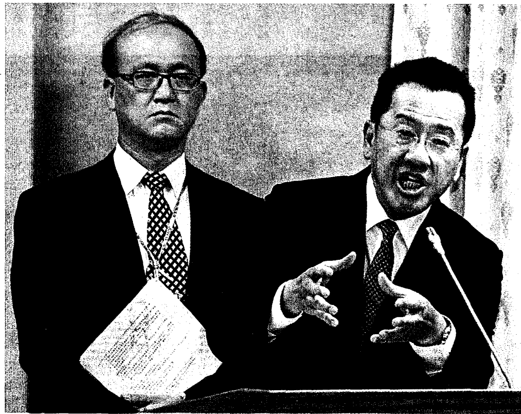
金管會主委顧立雄（右）與教育部次長林騰蛟（左）昨天赴立法院專題報告並備詢，就台大校長遴選案，一起上台說明。

顧立雄表示，會請證交所就上市櫃公司有關涉及公立大學的教授兼職的規定、過程以及流程，來做通盤的清查和檢視；如果教育人員任用條例有相關規定，本來就要依法遵循相關規定，不擔心上市櫃公司會因此找不到獨立董事，並將請證交所來釐清，上市櫃公司獨立董事申請程序等事項。