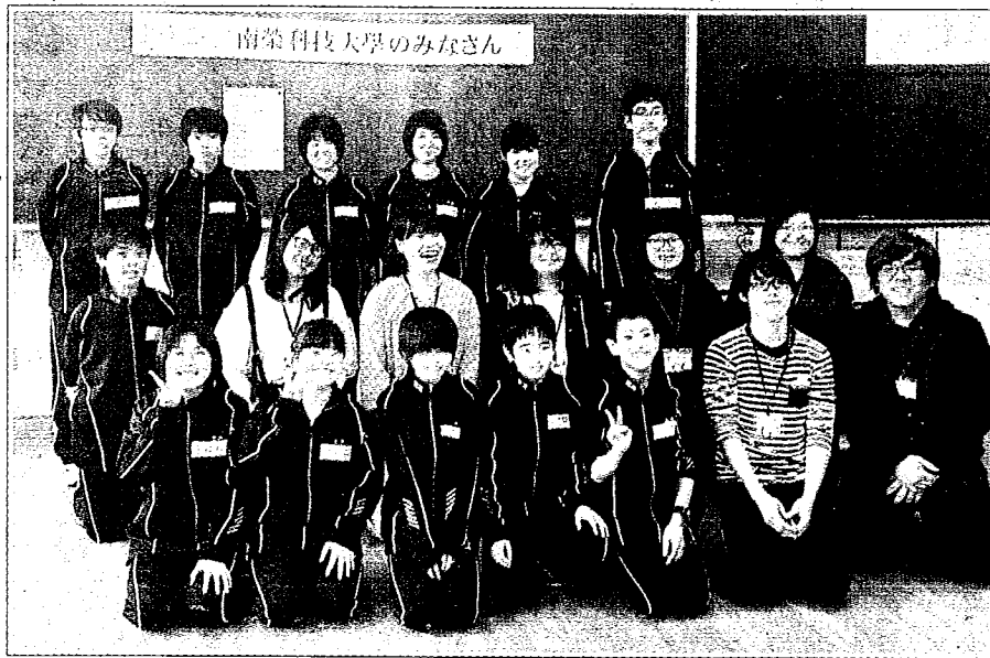
南榮科大實習生與日本北海道山部中學師生相見歡。 台灣時報3/版 (記者林福來攝)

南榮科大應日系學生大四下學期的校外實習以日本為主，目前學生在日本實習的地方涵蓋了北海道、新潟、長野、靜岡等縣市。