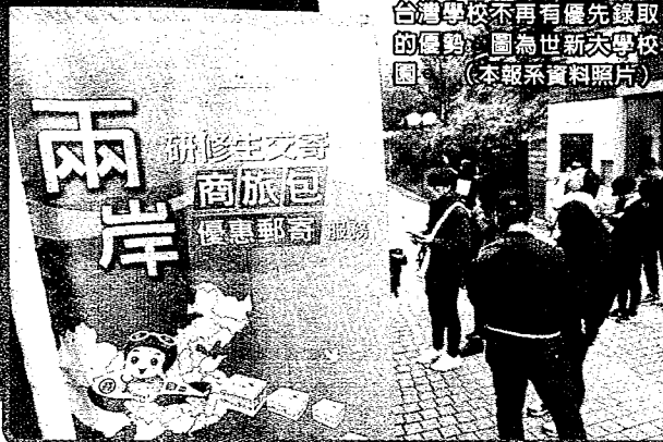
台灣學校不再有優先錄取的優勢。圖為世新大校園。

此外，也因為陸方不再讓台校優先錄取，2013年起台灣採用的「預分發」制度將無用武之處。「預分發」即「兩階段分發」，先公布正取、備取名單，接著給