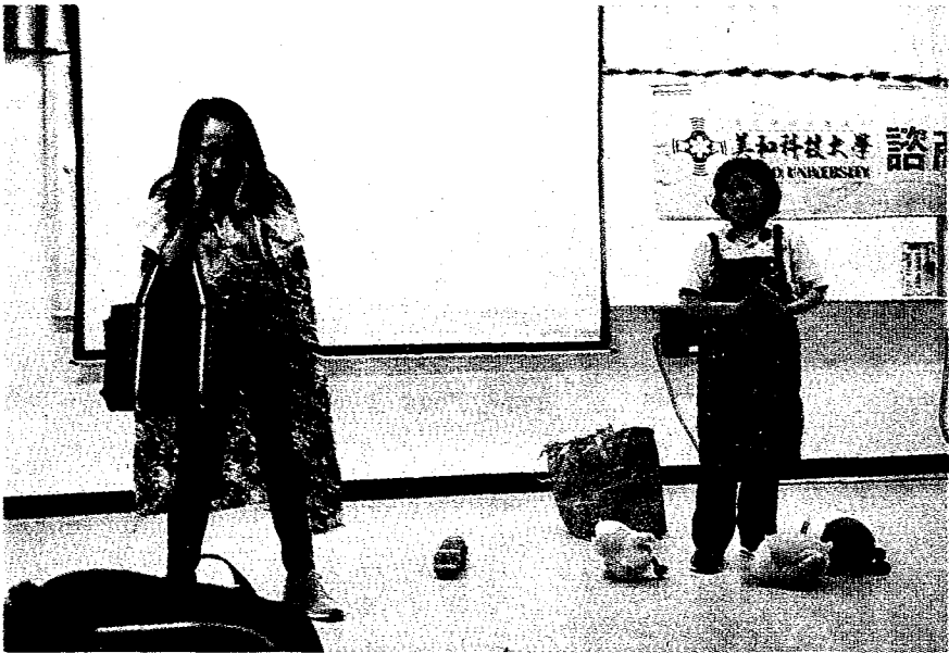
美和科大與左營高中展開性別平等交流活動，圖為左中學生表演精彩幽默的「反轉性別」童話故事劇。