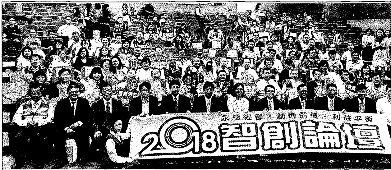
嘉藥二〇一八核心產品發表及創新發明競賽暨智創論壇。