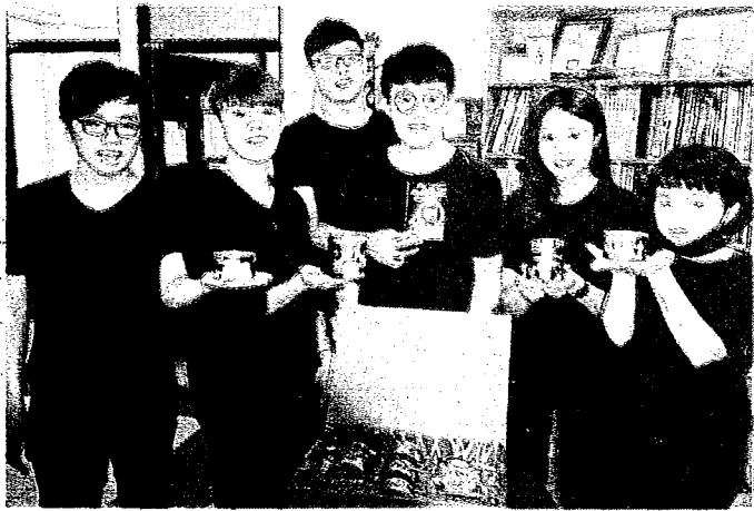
→大葉視傳系設計的「罐裝台灣」，入圍設計賽文化資產類和數位媒體類。

〔記者周為政員林報導〕行政院文化部「A+創意季」設計競賽，大葉設藝學院有十八件作品入圍，其中，由視傳系設計的「罐裝台灣」，同時入圍文化資產類和數位媒體類。多媒體學程動畫「小貓尼路」，獲放視大賞特別獎。