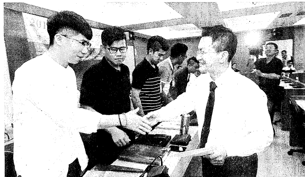
縣長魏明谷向每位學員勉勵。