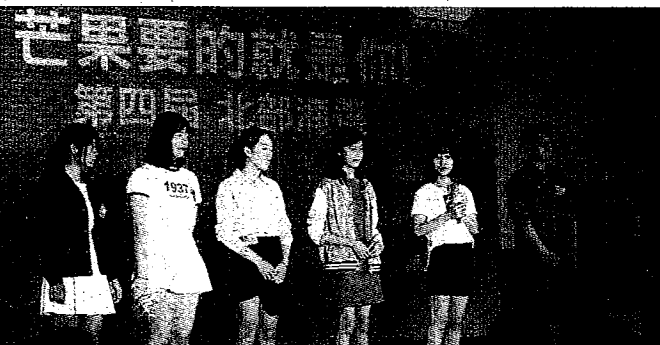
第四屆「芒果要的就是你-湖南廣電實習培訓活動」，24日在台北中國時報大樓進行北部場總決選面試。圖為參賽者。