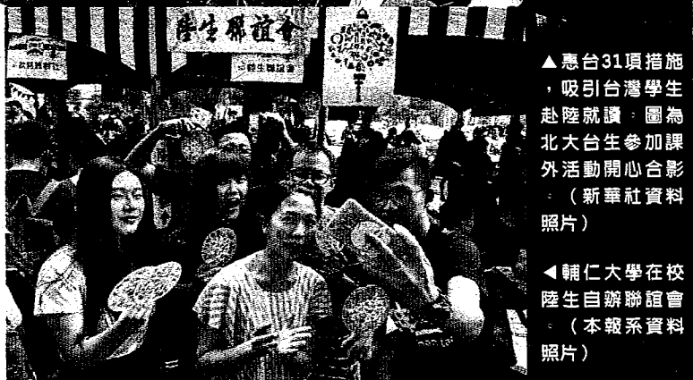
▲惠台31項措施，吸引台灣學生赴陸就讀。圖為北大台生參加課外活動開心合影

大，何況現在大陸片面刪減學生人數，台校端也無法找到對口溝通，監委認為這正顯示我國招收陸生平台缺乏彈性。監委表示，上述調查意見，將函請政府督促所屬及教育部確實檢討改進；綜合來說，教育部應檢視相關限制並通盤檢討，務實解決問題。