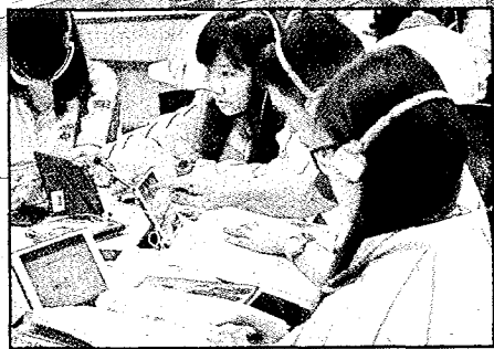
右圖：北市中崙高中、和平高中及南湖高中3校「異校結盟」，讓學生跨校選修課程，透過網路學校上課。