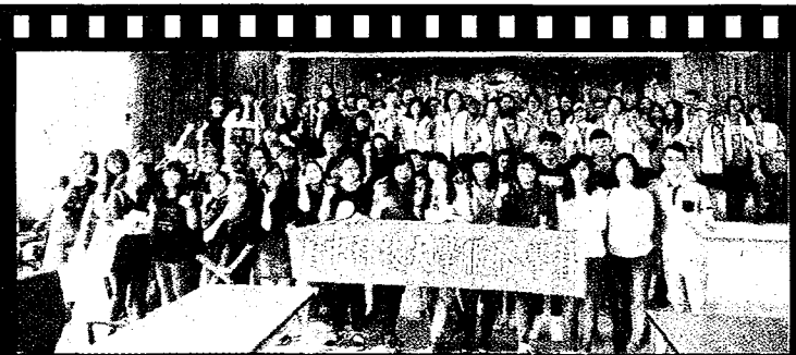
3月30日彰化田中仁愛之家長照關懷活動。