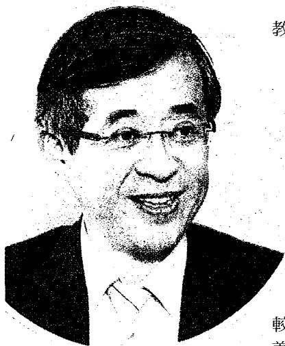
教育部代理部長姚立德