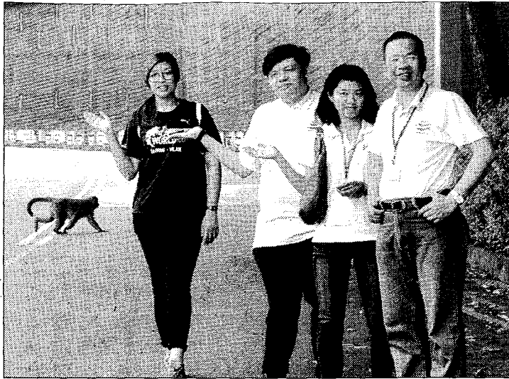
佛光大學猴群慈眉善目，校園人猴關係和諧。