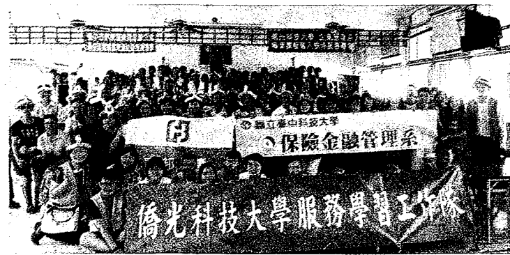
5月30日豐原東涌里活動,展現社區服務的價值。

學生們發揮在「內涵服務學習課程」所學,3月23日與富邦人壽志工同仁們,一同前往南投仁愛之家,透過參與公益活動回饋社區,當日陪伴近200位長者玩桌遊,增加跨齡互動交流,並實踐富邦人壽積極運用桌遊推廣預