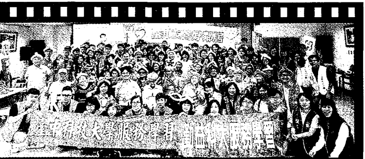
5月11日太平聖心聖愛山莊活動合影。