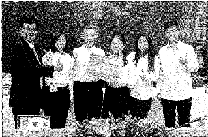
全國技專英語新聞廣播比賽，一〇七年非應用外組第一名。