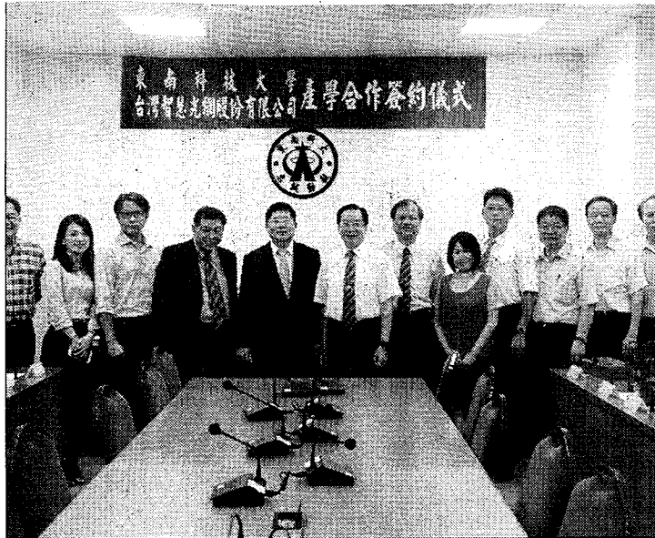
東南科技大學與台灣智慧光網公司簽訂產學合作。