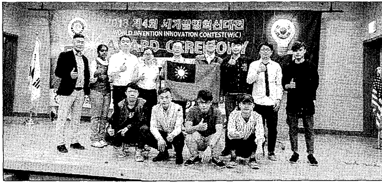
大葉大學師生挑戰韓國世界創新發明大賽，抱回七金二銀四特別獎項。