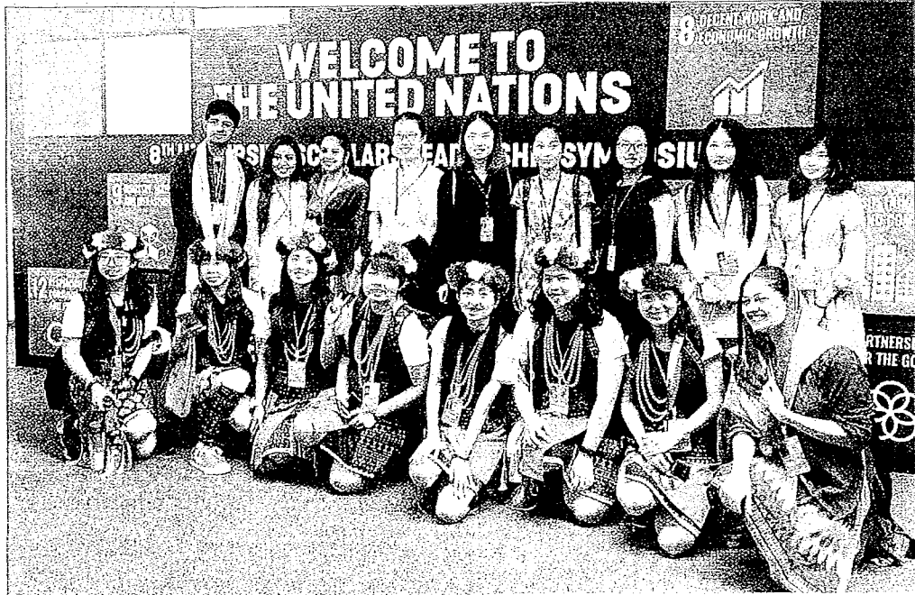
樹德科大學生積極參與國際活動。