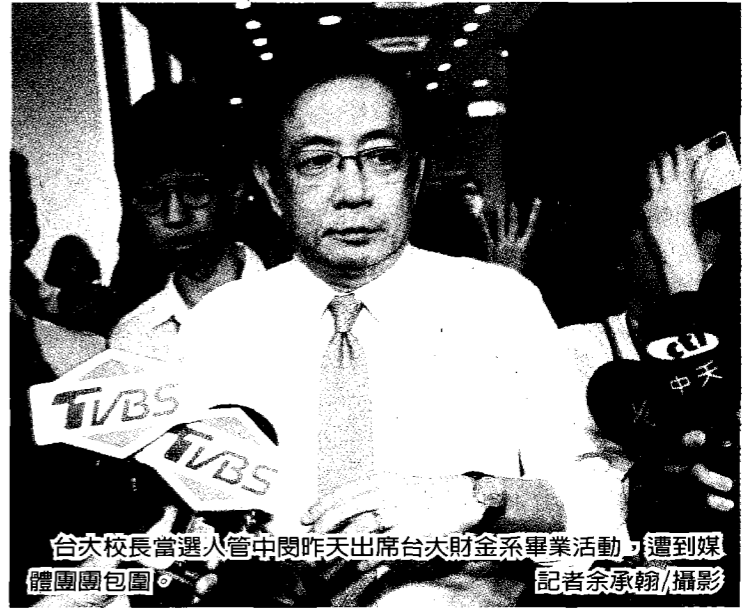
台大校長當選人管中閔昨天出席台大財金系畢業活動，遭到媒體團團包圍。