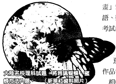
大陸名校理科試題，將蝴蝶翅膀鑿空作為考題。

另外，大陸各大城市為吸引優秀人才，各省市陷入人才爭奪戰，則成為西南財經大學的自主招生面試考題，並詢問考生怎麼看待此現象；一名報考該校的考生指出，「這道題是比較宏觀，需要我們在平時就對這類情況掌握了解，才能有足夠的知識來充分解答。」