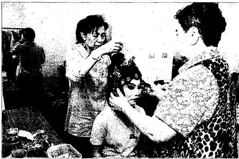
↑靜宜大學中文系「南管戲曲校園推廣計畫」，學員粉墨登場。 (記者陳金龍攝)