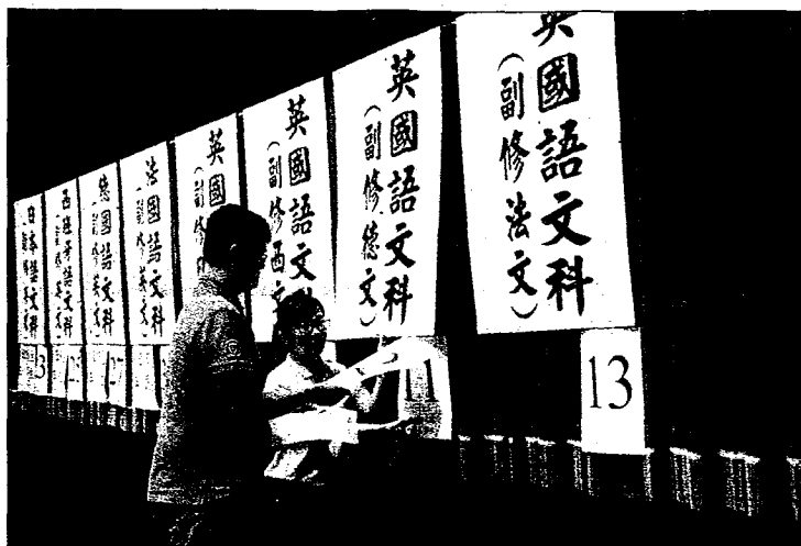
五專優先免試入學試辦電腦填志願，一改傳統的撕榜方式。圖為文藻五專部報到學生撕榜畫面。