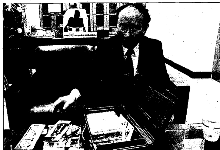
台北科大為五專新生準備了專屬的工具箱，作為新生的見面禮。