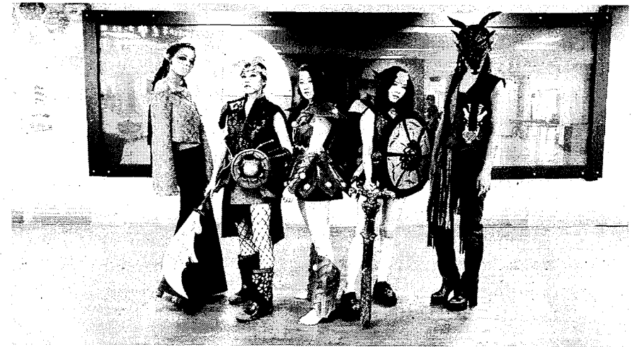
屏東科技大學時尚設計系13日在玉崗圖書館舉辦「藝術與時尚」聯合展。

該次聯合展覽不僅代表跨越世代的合作，年輕族群創意無限的青春能量，帶動長者對追求新知的意願，而長者豐富的人生歷練，也能成為年輕人的心靈導師，為彼此的創作增加更多內涵，兩者相輔相成在學業及人生道路共同成長，加深彼此友誼，也成為創作上相互扶持的力量。