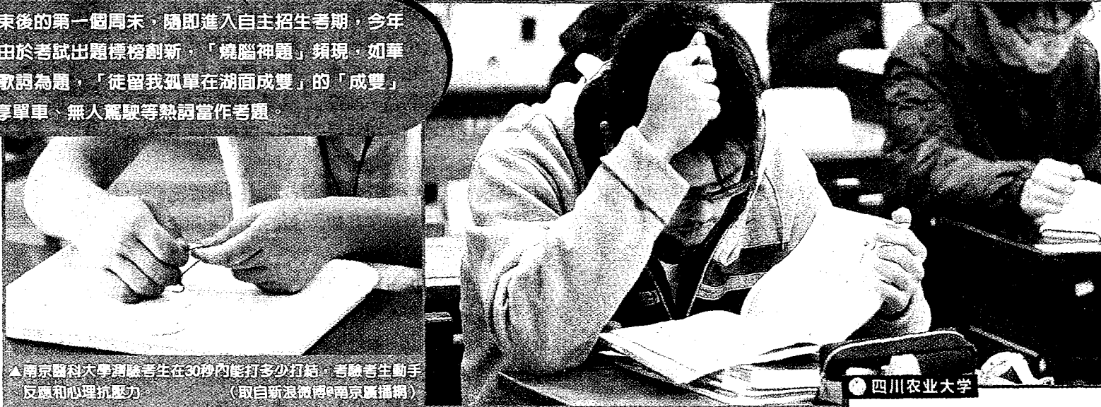
▲南京醫科大學測驗考生在30秒內能打多少打結，考驗考生動手反應和心理抗壓力

大陸有90所大學在上周末舉行相關考試，其中也包含北京大學及北京清華大學，而通過北大初審的考生人數為1719人，北京清華通過初審考生為1172人，兩校自主招生初試資格考生人數接近