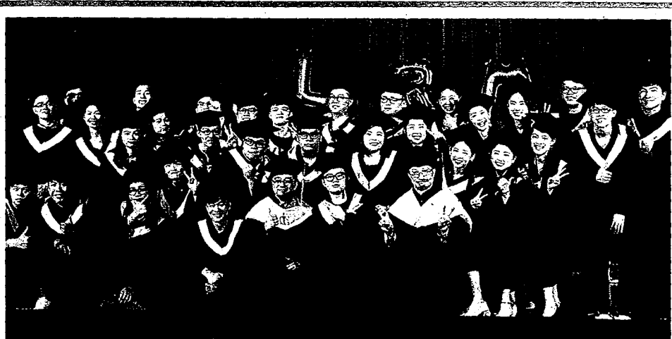
大葉休閒系師長為畢業生正冠。