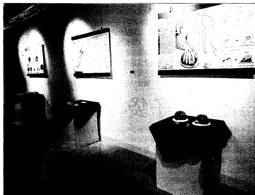
環科大創意商品設計系畢業成果展「設即是空」於至高館展出，學生發揮無限創意設計商品，內容豐富多元，歡迎市民參觀。