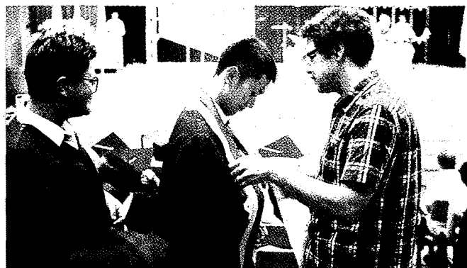
文藻外大畢業典禮結合畢業感恩授帶禮，師長將代表文藻精神的黃綠禮帶披在每位畢業生的肩上，期待畢業生秉持校訓「敬天愛人」的精神，為社會服務。

才能有真正的圓滿，人生才會滿足並且擁有永恆生命的美好果實。她期勉畢業生，全心、全意、全靈、全力，愛天主並且愛別人如同愛自己，人生必將充滿滿足、喜樂及平安。