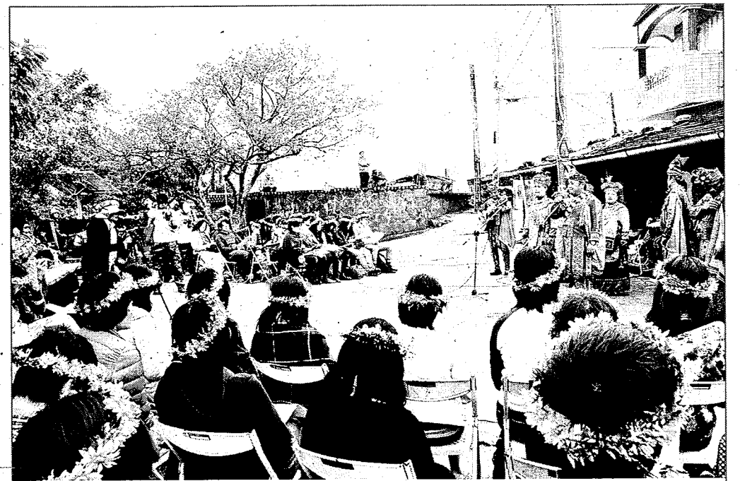
屏科大係全台今年唯一通過里山倡議申請的大學。