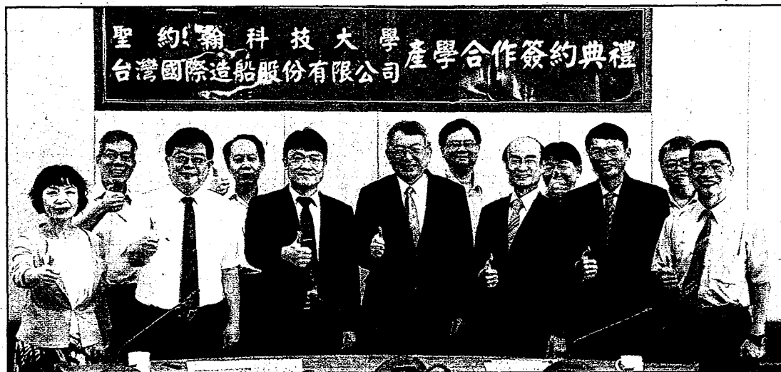
聖約翰科大與台船公司簽署策略聯盟圓滿順利雙方開心合照。