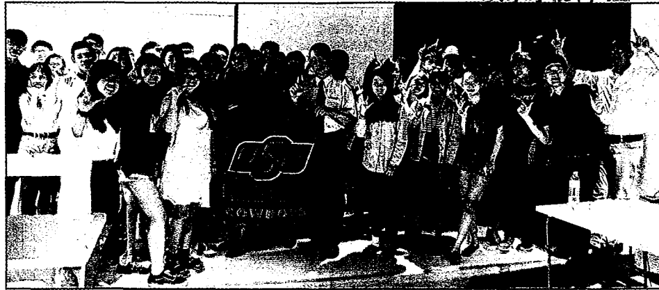
大葉與美國奧克拉荷馬大學「雙學聯制」合作，只要在台灣和美國各讀二年，完成修業規定就同時取得兩國大學學歷。（記者周為政攝）