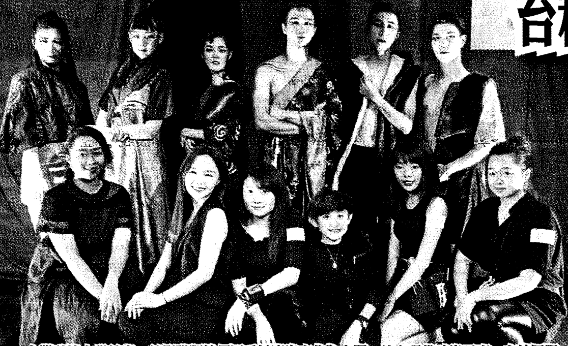
台灣科技大學美容、美髮職類技優國手以廟宇文化為主題，結合現代時尚元素，在校園舉辦走秀，學生化身媽祖、地藏王等角色，展現創意設計。

【台北訊】台科大美容、美髮職類技優國手以廟宇文化為主題，結合現代時尚元素，在校園舉辦走秀，讓學生化身媽祖、地藏王等角色，展現創意設計，也藉此希望大家關注傳統文化。