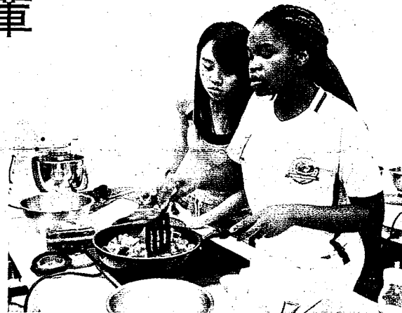
史瓦帝尼的狄語謙（右）與同學設計一道絲瓜炒杏鮑菇。