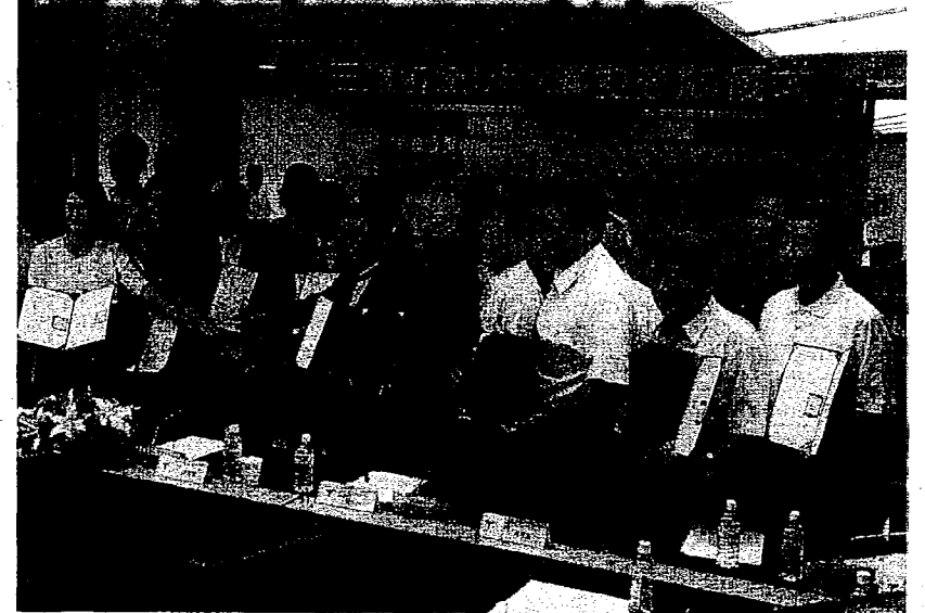
「善盡大學社會責任(USR)」。