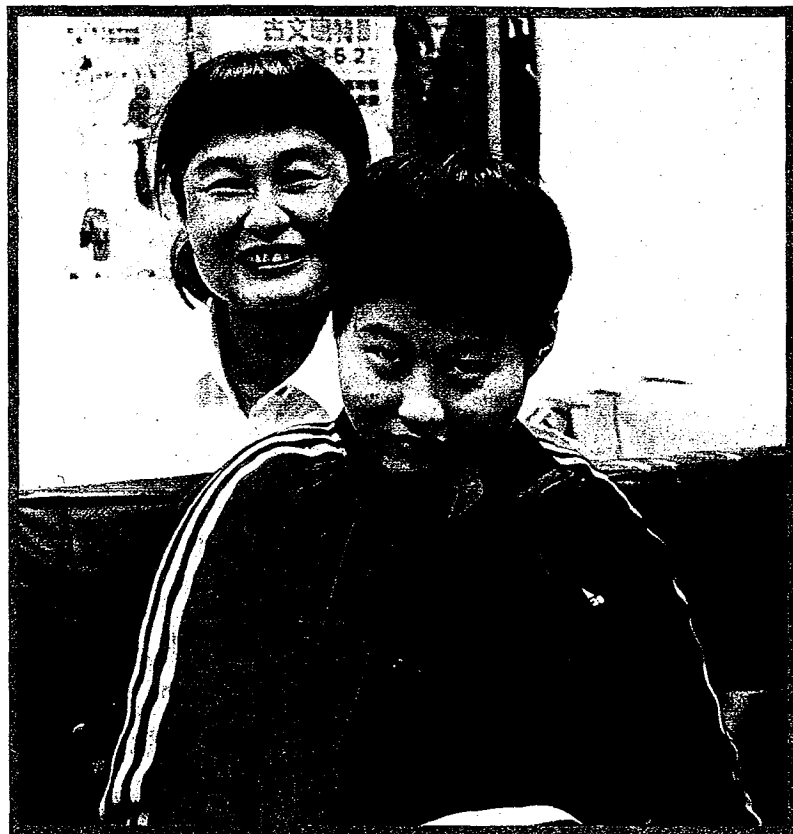
一圓多重身障生大學夢，慈母在台首大伴讀四年！