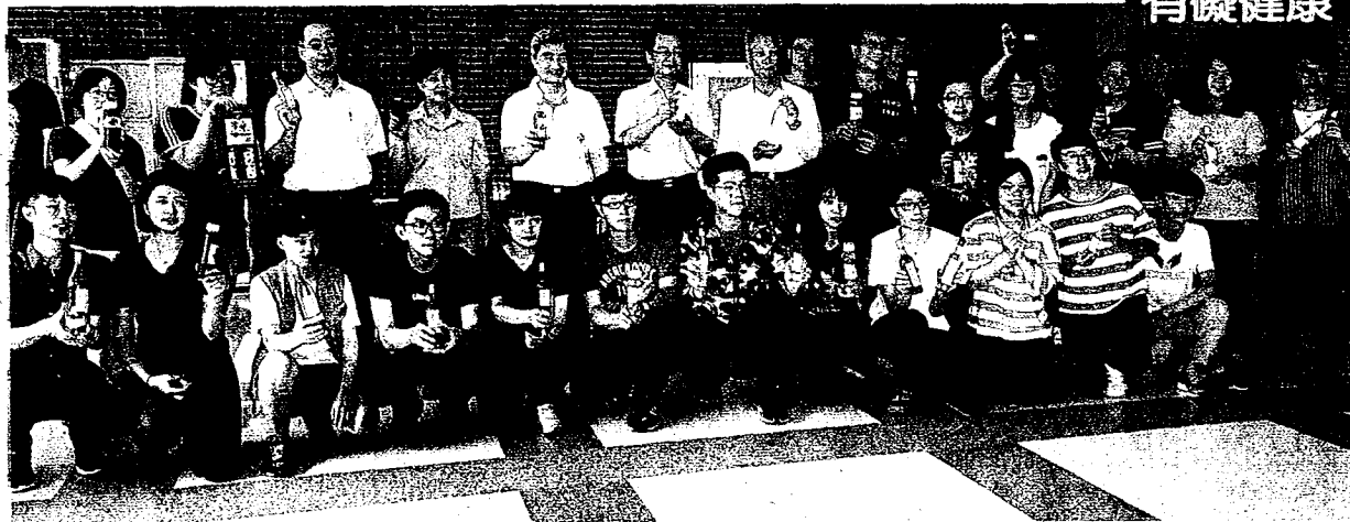
大葉食科系發表酒類釀造與實習成果。