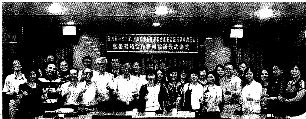
↑為建立兩岸高齡照顧產業人才培訓標準化制度，上海養老專委會與聖約翰科技大學簽署戰略合作，開展長期合作關係。

，聖約翰科大自105學年度成立老人服務事業系，培養長期照顧及社會工作等照服員及管理人才，且積極與雙連安養中心、仁寶電腦、臺高福、振興醫院及大直商圈…等單位策略聯盟，觸角伸入產官學界。與上海養老專委會簽署戰略合作框架協議後，盼能共同建立兩岸安養（養護）人才培訓及服務標準化模式，共創雙贏。