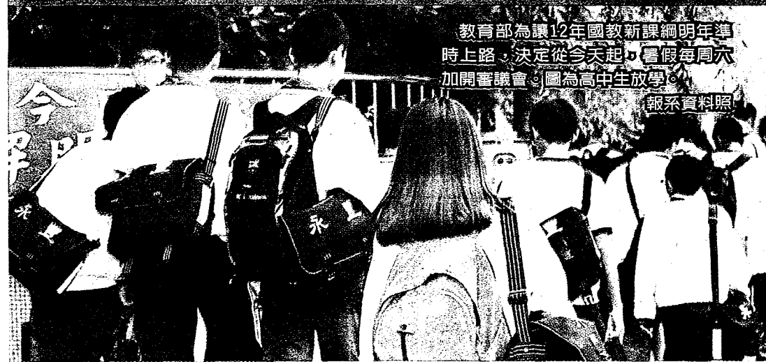
教育部為讓12年國教新課綱明年準時上路，決定從今天起，暑假每周六加開審議會。圖為高中生放學。