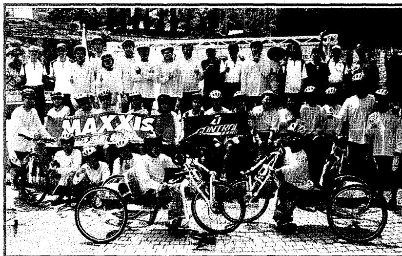
中州科技大學黃思倫校長在出發前特別授旗勉勵，希望參與的身心障礙學生勇敢面對壓力、接受挑戰。