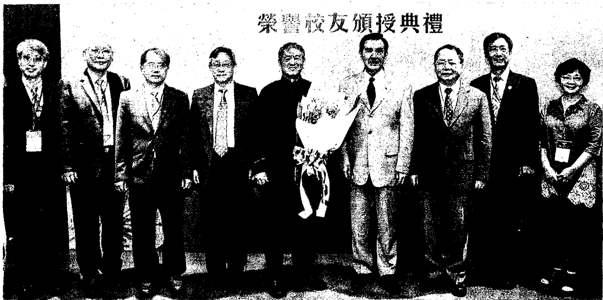
榮譽校友頒授典禮