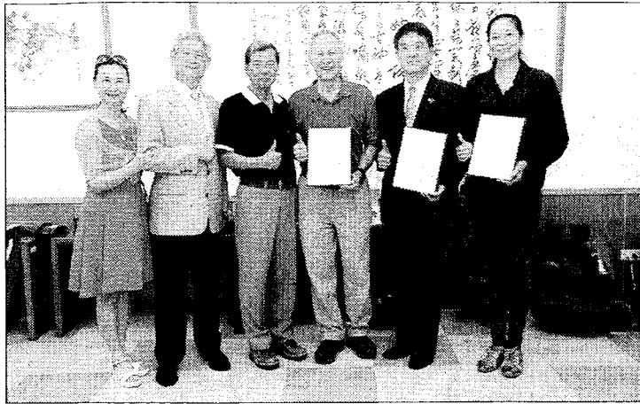
佛光大學頒發樂活產業學院「企業講座」聘書給知名的體育傳奇人士企業家林廷祥、帆船環球航海家劉寧生和奧運台灣第一面金牌陳怡安三人。