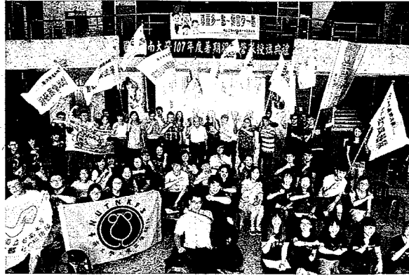
↑南大學生今年共組成十三支暑期營隊，將前往偏鄉中小學服務。（記者施春瑛攝）

記者施春瑛／台南報導 放暑假了，台南大學學生今年一共組了十三支暑假營隊將投入偏鄉服務及辦理專業知能營，準備要帶給學童一個多采多姿的暑假。 南大學生每年暑假都會組服務團隊下鄉服務，今年也不例外，執行