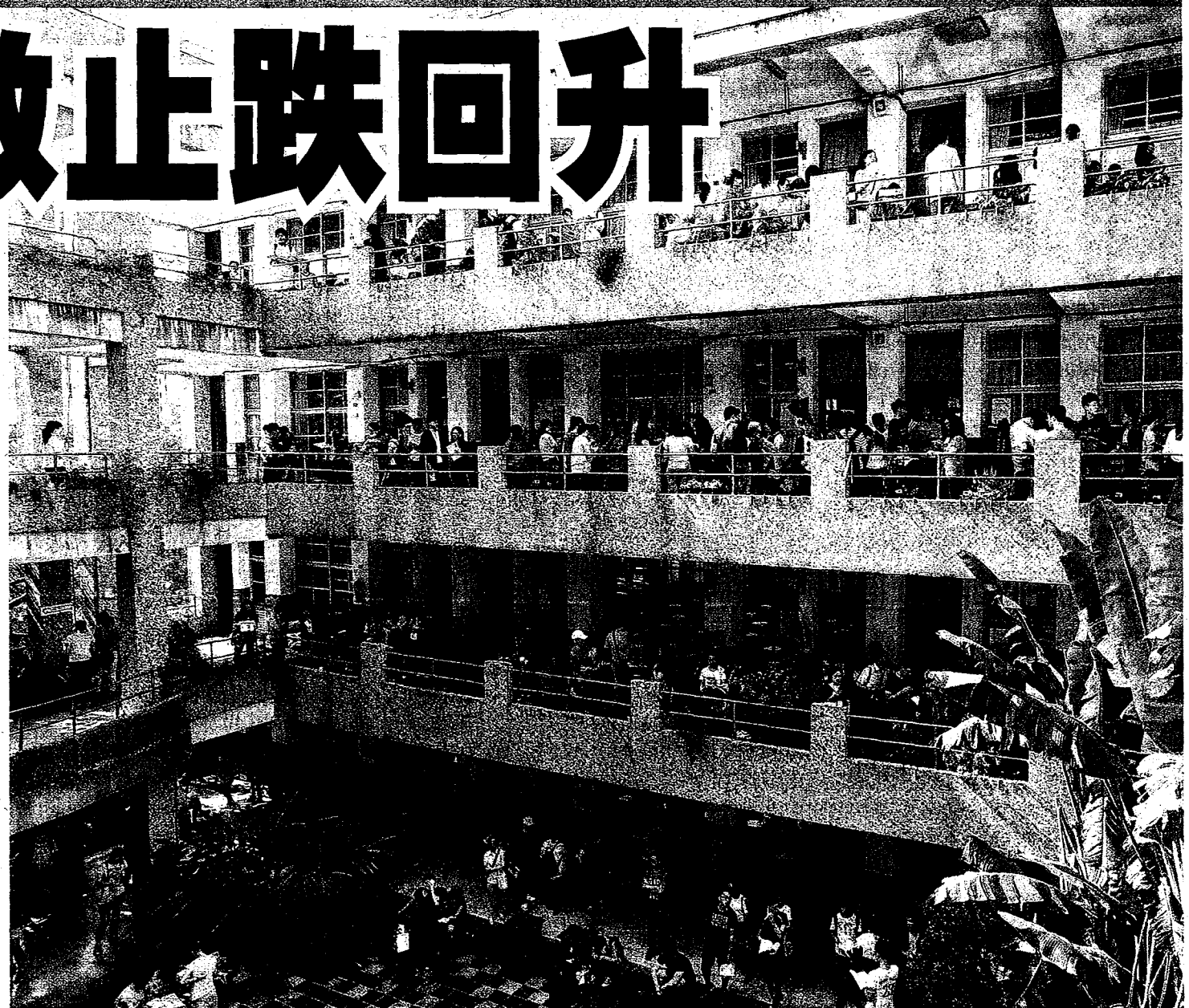
107學年度大學指考今天展開第一天，物理、化學、生物先登場，北部地區上午天氣炎熱，考生在高溫中奮力拚金榜。

今年指考國文科首度不考作文等非選擇題，全卷都是選擇題。大考中心表示，今年起國文、公民與社會兩科全為選擇題，其餘各科仍有選擇題及非選擇題。 相關新聞見A4版