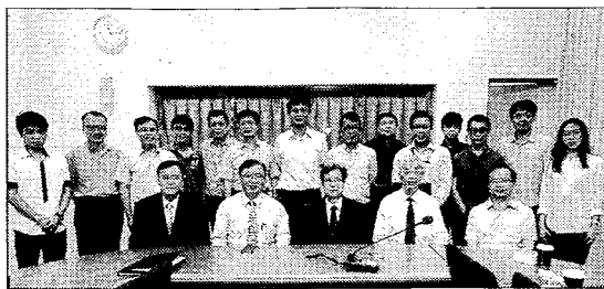
臺北大學與中國探針團隊合影。

這項產學合作計畫涵蓋兩項子計畫，兩位教授帶領的研究團隊，將從數位顯微鏡、以及硬體光學設計與軟體人工智慧技術，協助進行探針瑕疵檢測。其中教授團隊提出「探針瑕疵檢測之萬花筒成像研發」，研擬設計一套類似「迴轉壽司」的輸送帶，檢測員只要將探針置放上迴台，經過攝影機傳送多個不同角度鏡子影像畫面，就能無死角、有效掌握探針的面貌。而為了進一步以更智慧的方式判斷出探針的瑕疵並據以調整製程，林道通教授團隊則將進行「智慧辨識探針瑕疵檢測系統之先期研究與可行性評估」。