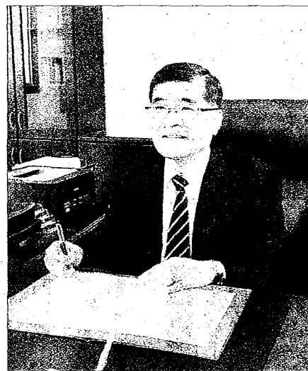
↑高雄醫學大學代理校長楊俊毓就任，盼全體教職員工「靜定」回歸校園，讓高醫體系「如實」正常運作。

記者王正平／高雄報導 高雄醫學大學代理校長楊俊毓一日就任，全球高雄醫學大學校友會聯合會隨即發表聲明強烈反對及嚴厲抗議，並表示不承認高醫董事會違法所選出的代理校長。