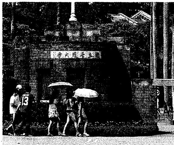
■身為台灣最頂尖學府，台大是企業獨董的大本營。 資料照片