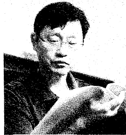
▲台大代理校長郭大維呼籲政府，正視為何高教人才、學生出走的問題。(Digitalfarmer / 維基百科共有領域)

對於他赴中是否有人刻意放消息？郭大維說，他說，許多教育人員憂心台灣對人才流失的憂慮，想想萬一他們不留在台灣怎麼辦，因此，他呼籲政府重視高教人才、能培育下一代的人才。◇