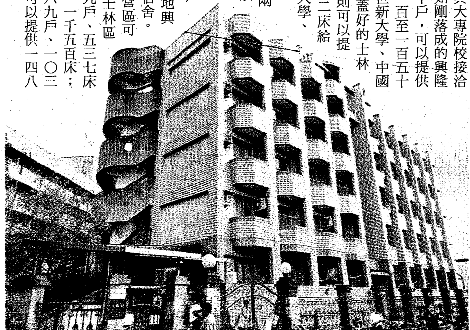
台北市大專院校廿六所，學生宿舍缺額達一萬四千七百七十二床，其中更有七所大學床位供需比低於七十%。圖為被認定違反土地使用分區相關規定的文化大學宿舍「大群館」。(資料照)

蘇貞昌指出，新北市的大專院校多達廿二所，學生有十五萬多人，他會採取社會住宅興辦規定，在淡水、林口等大專院校密集區，選擇區位適宜、交通便利的國有地、公有地，以無償撥用或長期租用方式，由政府、鄰近的大專院校及教育部三方合作或招商，興建大學生聯合宿舍，針對