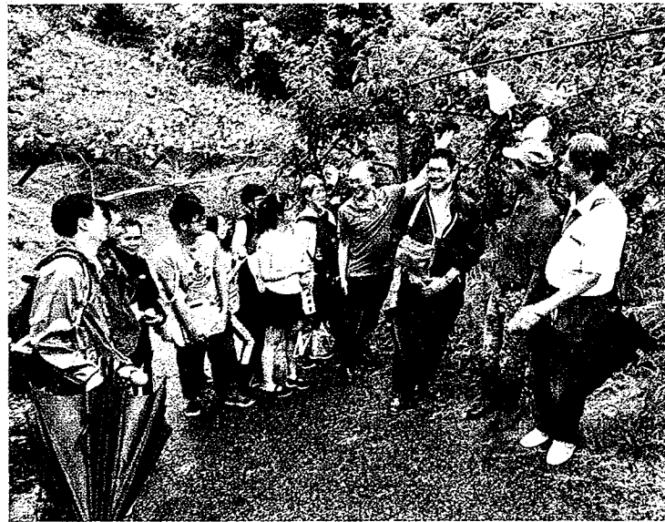
泰國皇家計畫基金會人員實地至東勢梨園，了解朝陽科大透過費洛蒙技術防治東方果實蠅之具體成效。

【台中訊】15年前，果實蠅肆虐，讓泰國淪為疫區，包括山竹、酪梨、石榴、波羅蜜、紅毛丹等十多種鮮果，一度禁止進口到台灣。為了協助泰國防治蔬果病蟲害，財團法人國際合作發展基金會啟動「蔬果病蟲害綜合防治計畫」，由泰國皇家計畫基金會選送泰方技術人員分批來台進行為期一周的專業訓練，委託朝陽科技大學應用化學系辦理東方果實蠅防治技術推廣訓練活動研習課程，分享台灣在果實蠅綜合防治與管理之經驗，環境友善資材運用現況及成效以及植物疫情動態監控與通報系統發展。