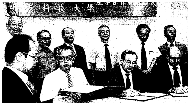
明志科技大學智慧醫療研究中心攜手ARBURG公司，成立醫療器材培訓中心。

【新北訊】為加速智慧化系統整合技術平台開發及研發創新醫療器材，明志科技大學於107年成立智慧醫療研究中心，以預防醫學（preventive medicine）、創新醫療器材為基礎研發方向，期望達到智慧化技術整合、技術移轉及成立新創公司為目標。