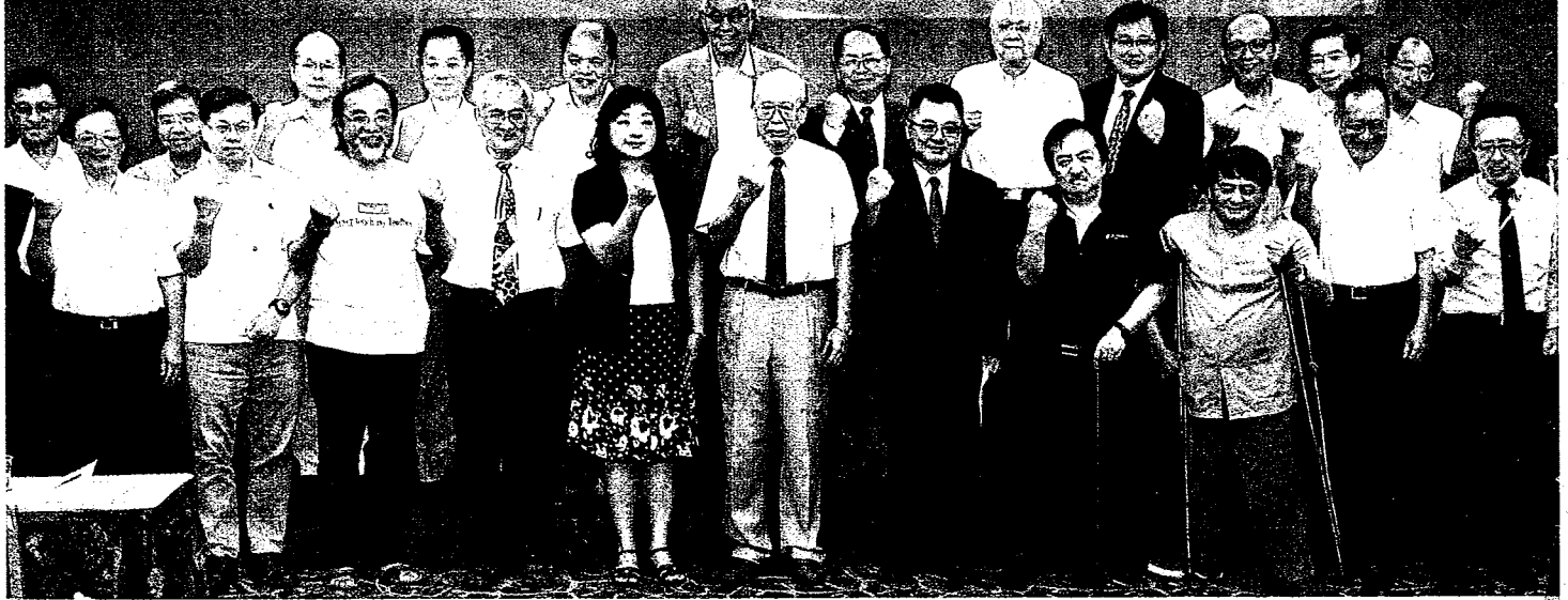
包括台大、台師大、政大、清大、交大等十多所國立大學校長、教授，昨天共組「全國大學自主聯盟」，要求政治黑手退出校園。

Taiwan Action Alliance for University Autonomy International Press Conference