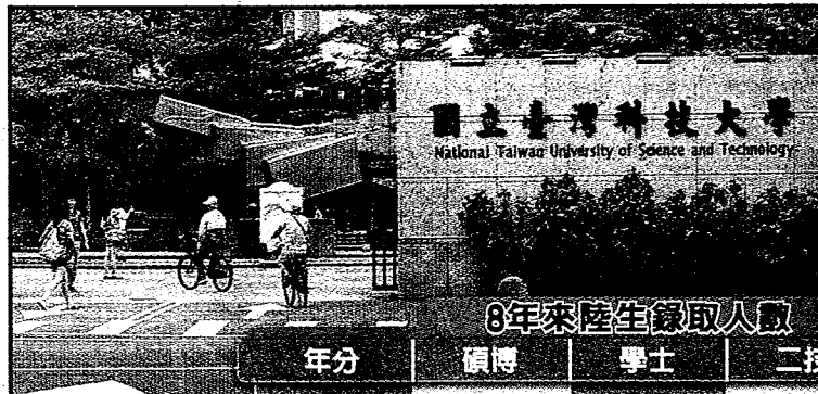
◀今年台灣科技大學招到49名陸生,排名第二。圖為台科大大門。(本報系資料照片)