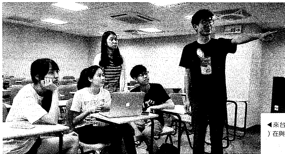
◀來台就學的陸生(站立者)在與台生交流。

57校1500個名額僅招到285人 達成率19.0% 成績不算好 / 本報系記者簡立欣 / 台北報導