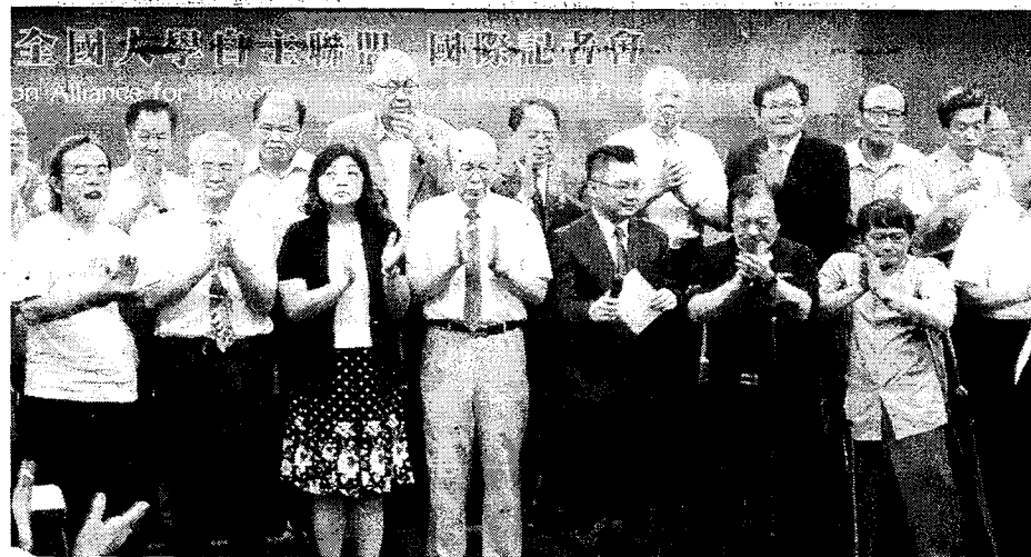
全國大學自主聯盟昨日舉行國際記者會，台大前校長李嗣涔（中）表示，台灣高教鬧出了國際笑話「台大沒校長、教育部沒部長」。