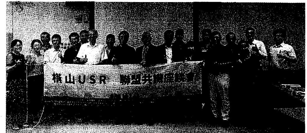
橫山USR聯盟共識座談會。

高雄海洋科大三校合併成的高雄科技大學，晚近二十年的發展裡，皆停滯在與大學生的租賃關係，隱蔽社區內的橫山營區，更添神祕，附近大學也鮮少與之互動；為促進大學菁英創作，望向在地需求、優化社區、產企業的工作環境及生活品質，因而有了是項計畫構想。