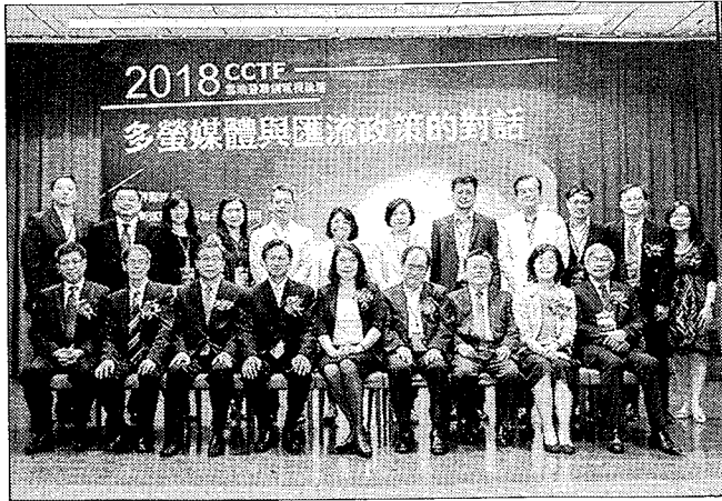
「2018 CCTF雲端暨聯網電視高峰論壇」於世新大學舉行。

要整合閱聽眾的行為、發展分析收視率與社群媒體的資料應用能力，才能有效地以數據創造價值，使OTT產業發展更臻完善，台灣OTT產業面對網路盜版影片影響收益、中國OTT平台傾銷影劇內容等問題，盼政府營造OTT公平競爭環境、建立穩定長期的影音內容獎勵及補助政策，如4K、VR技術與台灣本土文化價值等內容，須透過