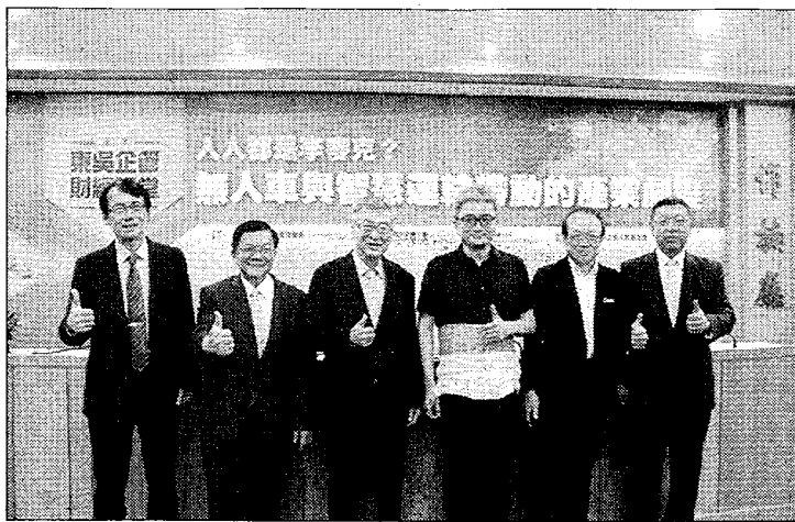
東吳大學企業管理學系舉辦第三季「東吳企管財經講堂」。