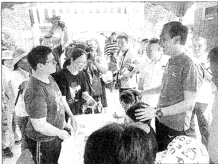
東南科大AR遊戲受歡迎。