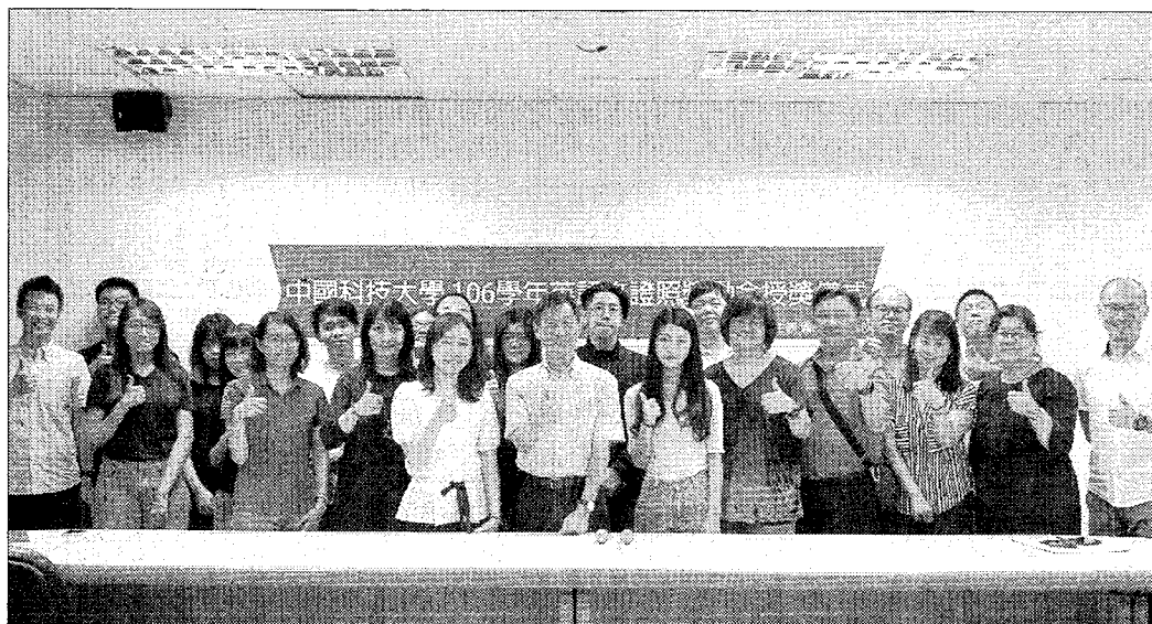
中國科大頒發英語文獎勵金鼓勵向學。