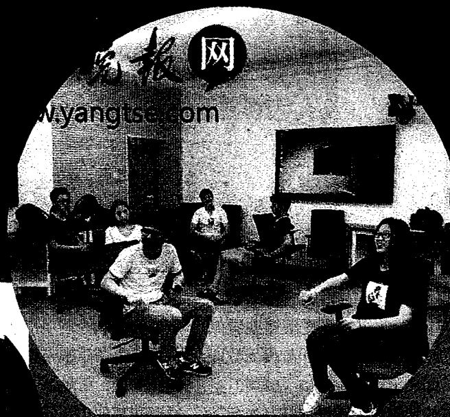
▲課程角色扮演情境互動。

◀《老男孩》奪下2018陸劇冠軍寶座，讓人好想談戀愛。