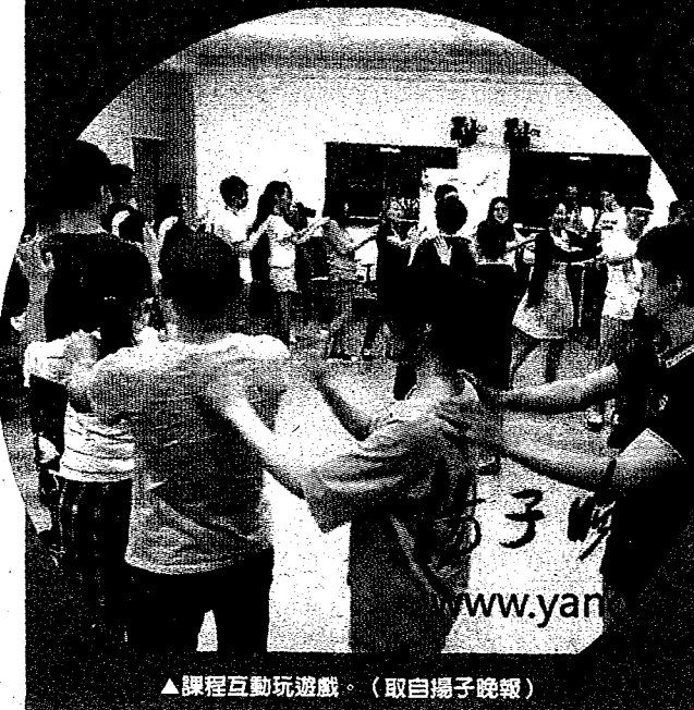
▲課程互動玩遊戲。

戀 愛課程走進大學課堂，是大陸近期被熱議的新潮教學內容。近日，河南徐州的中國礦業大學公共管理學院開設一門「戀愛心理學」選修課在網路爆紅。在該校開放的課程平台上，這門選修課點擊量超過了120萬次，在線選課人數累計突破了1萬人，僅在礦大就有600多名學生選修該課程。