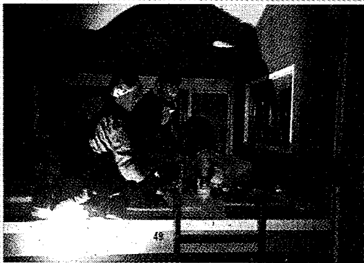
■成大登山社學生住宿南湖山屋，被指違規在室內床上煮食。