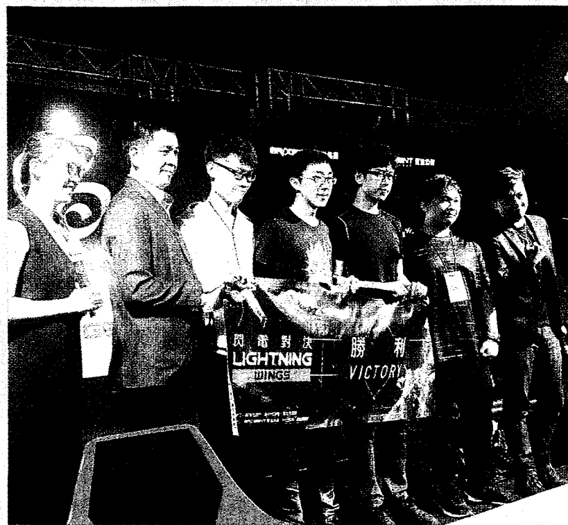
VR體感電競南區預賽。

坊與電競館，提供系上無後顧之憂的培育創新娛樂應用人才，也為在地的高雄市積極推動高雄軟體園區，努力成為AVR新創基地。