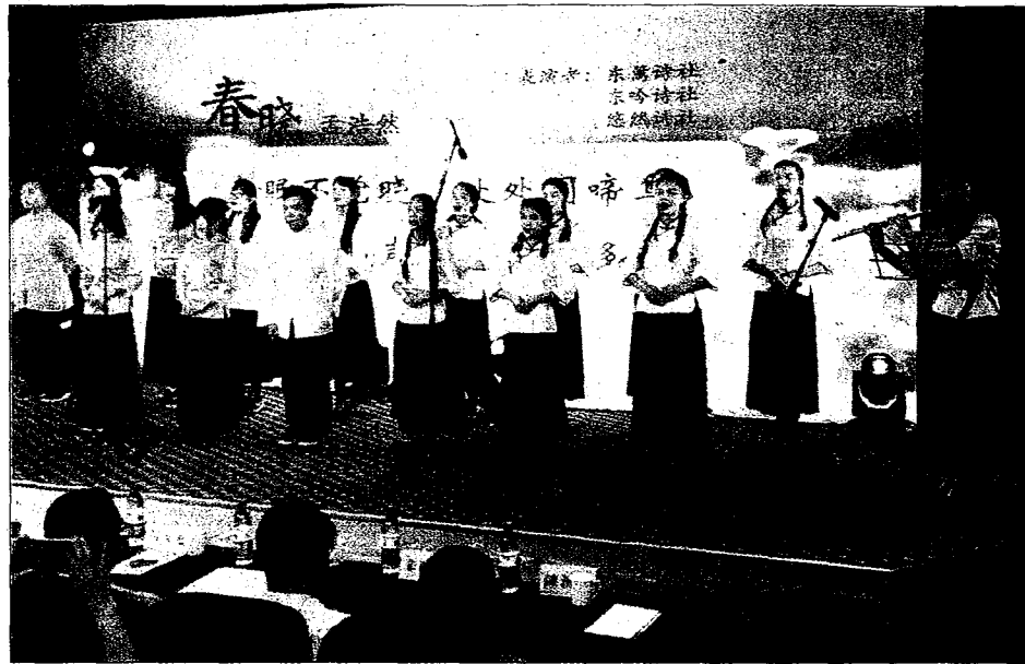
由兩岸大學生共同演出的古典詩詞吟誦。

徐州市副市長徐東海在受訪時指出，徐州是大陸全國交通樞紐、來往各地非常方便。近年來，台灣朋友到徐州者可謂是絡繹不絕。徐州也是淮海經濟帶的中心城市和「一帶一路」重要節點，希望有更多台灣青年朋友