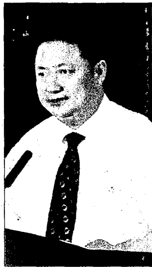
大陸江蘇省徐州市副市長徐東海。