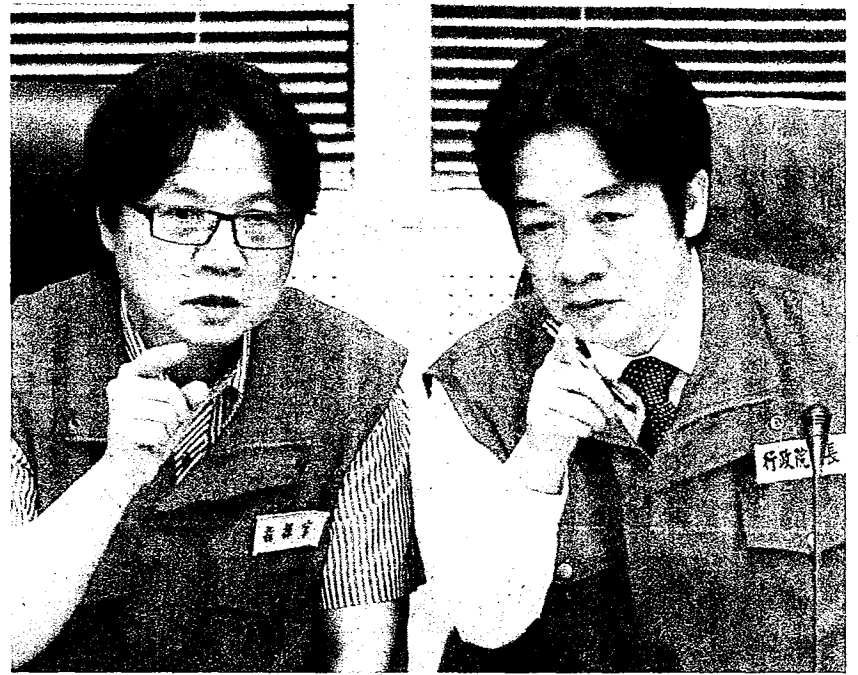
由內政部長轉任教育部長的葉俊榮（左）說，這幾晚他在中央災害應變中心來回踱步，思考是不是要第二次「擦落去」，昨晚才終於決定接掌教育部。右為行政院長賴清德。

【記者林河名／台北報導】懸缺一個多月的教育部長，確定由內政部長葉俊榮接任。行政院長賴清德昨天表示，邀請葉俊榮出任教長有三個原因，包括學術地位、耐性和毅力，以及理想和創新。賴揆特別感謝葉俊榮過去「拔刀相助」出任內政部長，現在再一次「兩肋插刀」出任教育部長，「他真的是一個認真為國家做事的人」。