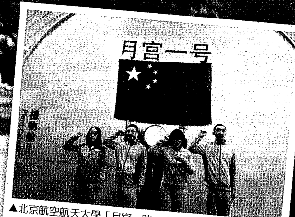
▲北京航空航天大學「月宮一號」實驗室進行「月宮365」一年期實驗，再次刷新人類密閉生存的世界紀錄。