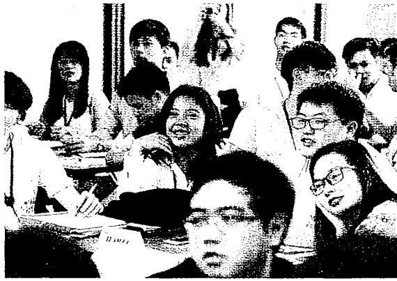
▲台科大舉辦新南向創業營隊，外國學生來台上創業課。