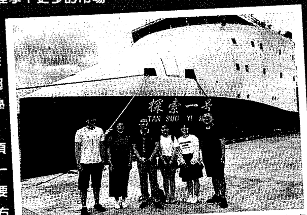
▲7月8日，上海交通大學船舶海洋與建築工程學院參觀「探索一號」科考船。

自領域的世界一流。而且這些做法顯然已經見效，越來越多亞洲、歐洲和非洲的學生選擇到大陸留學。