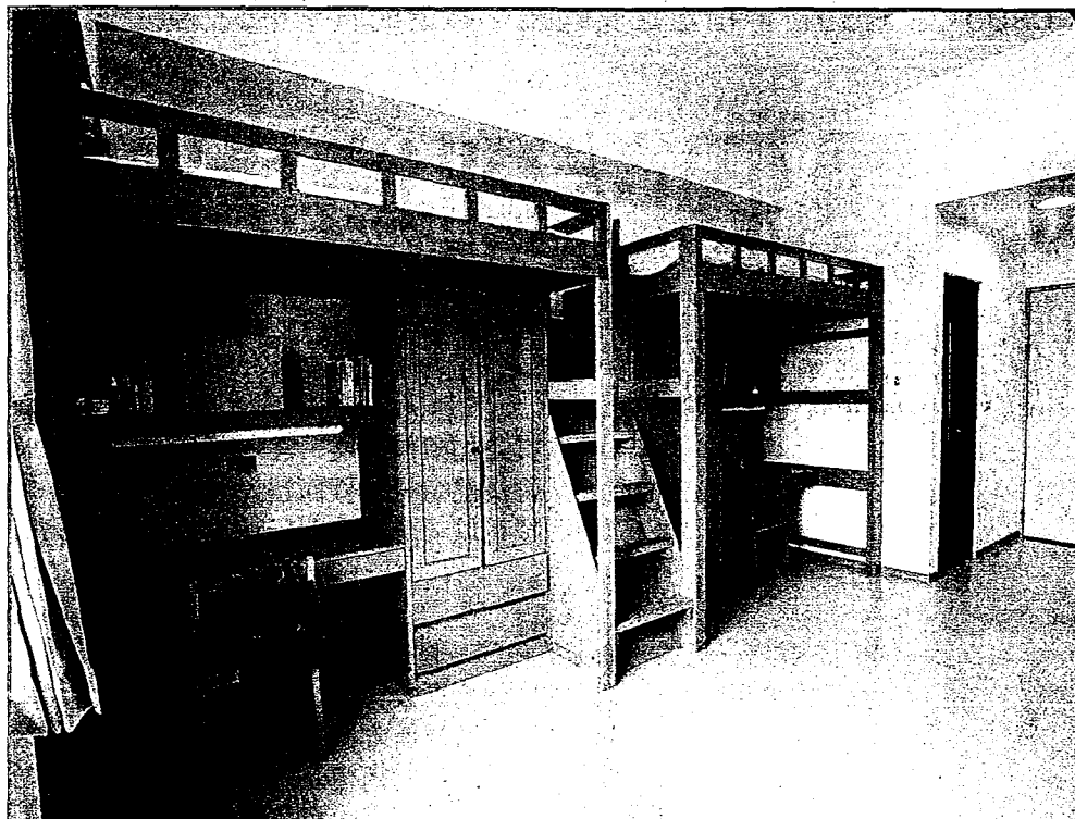
嘉藥打造樂活宿舍環境，床位五千冠全國私大，宿舍內寬敞、新穎，且設有獨立衛浴設備！

〔記者林福來台南報導〕嘉藥打造樂活宿舍環境，床位五千冠全國私大！近來，大專院校宿舍成為社會關注議題，不少大學因提供床位數量不多而倍受批評。