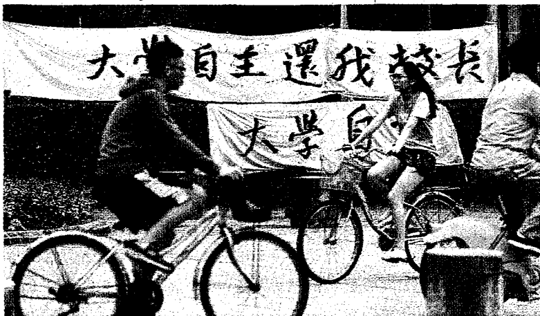
16日有台大學生向台北高等行政法院提「定暫時狀態假處分」，在訴訟判決確定前，應聘管為校長。圖為台大校園內力挺「大學自主」布條。