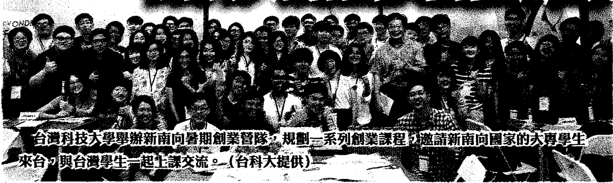
台灣科技大學舉辦新南向暑期創業營隊，規劃一系列創業課程，邀請新南向國家的大專學生來台，與台灣學生一起上課交流。

【台北訊】台科大舉辦新南向暑期創業營隊，規劃一系列創業課程，邀請新南向國家的大專學生來台，與台灣學生一起上課交流，分組競賽獲勝隊伍還能獲得創業輔導資源。