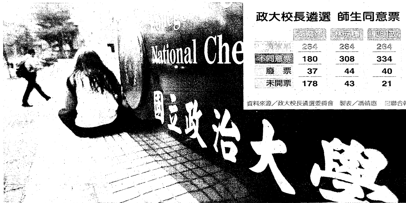
政大新校長將於下周日出爐，此次遴選制度引起討論。