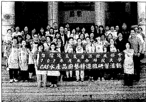
東南科技大學觀餐休閒與管理學院辦理CAS水產品廚藝精進班。