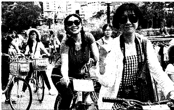
▲兩岸冷對抗！私校暑期專班陸生來台人數驟減。圖為陸生到日月潭遊玩感受台灣之美。（本報系資料照片）

是該校姊妹校，其中僅山東師範大學、哈爾濱工業大學的陸生逾10人來台，另如華中農業大學等陸校陸生，最多只有3到5人，「通常與台灣關係比較好的廣東、福建，陸生來台人數最多，今年這兩個省市沒有學校來，我覺得很奇怪！」