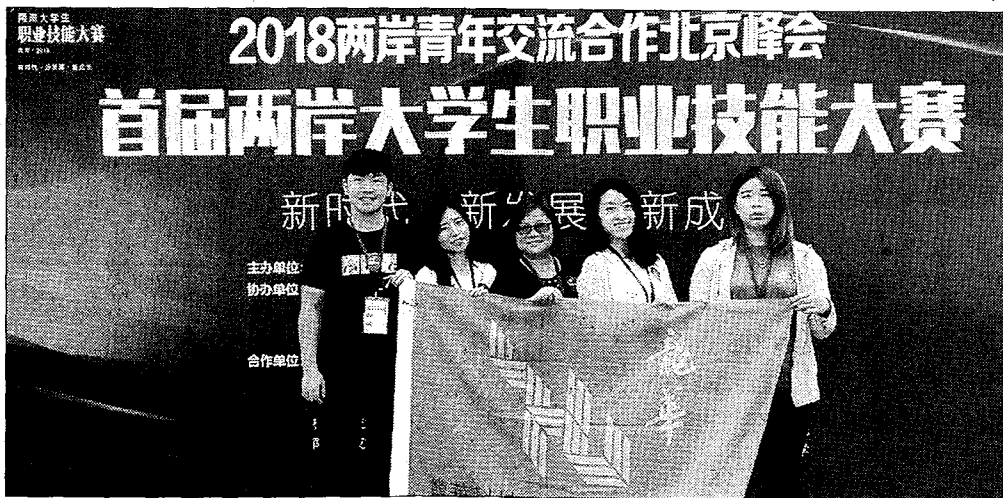
龍華科大跨域團隊「智能空淨管家」兩岸大學生職業技能大賽獲一等獎。