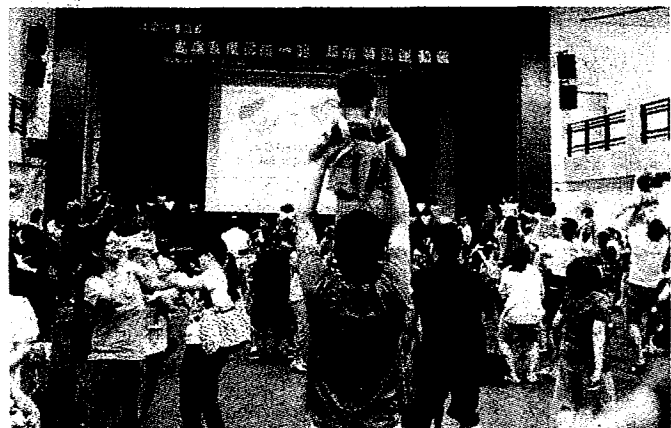
中原大學成立「全人關懷早期療育研究中心」迄今已15年，除提供發展遲緩兒童及其家庭的服務與支持。

中原大學成立「全人關懷早期療育研究中心」迄今已15年 攜手桃園市府以趣味競賽獻上畢業祝福