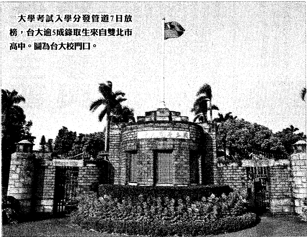
大學考試入學分發管道7日放榜，台大逾5成錄取生來自雙北市高中。圖為台大校門口。