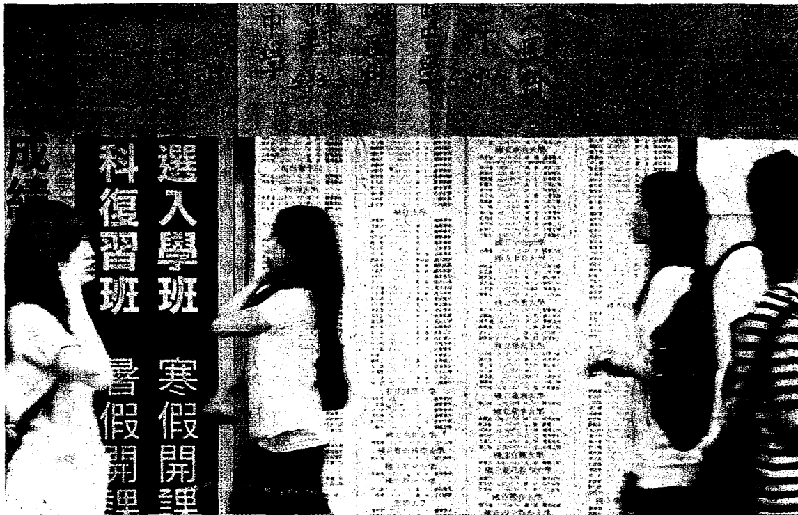
↑大學入學分發榜，錄取四萬三百零一人，是歷年來最少。

【記者馮靖惠／台北報導】大學考試入學分發昨天放榜，因報名人數增加，今年錄取率近九成，創近六年新低；九校缺額三六四人，也創四年新低。大學考試入學分發會主委、成大校長蘇慧貞分析，今年缺額大幅降低，與這兩年各校處理招生員額較務實有關，不少校系把名額先「寄存」起來。