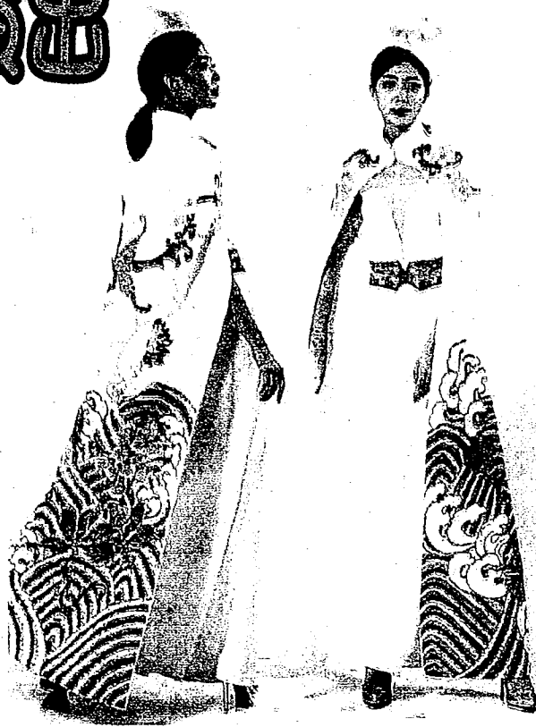
台南應大參與演出「第二十七屆亞洲洋服同業聯盟大會」！

在這裡，你可以看見日本匠師對於技術工藝的執著態度、韓國匠師對版型的概念解析，以及台灣匠師對文化與時尚的創作融合，那種深刻的感動，不在現場的人真的無法體會。參與國際盛事是個加油站，觸動了每個人心底對服裝的執著，走入這個深深影響洋服的亞洲國際盛會，將會有不虛此行的感受，亞洲的頂尖匠師齊聚一堂共同為技術產業傳承努力。