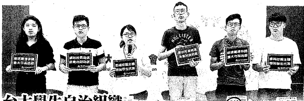
台大學生自治組織對於台大校長遴選爭議的訴求