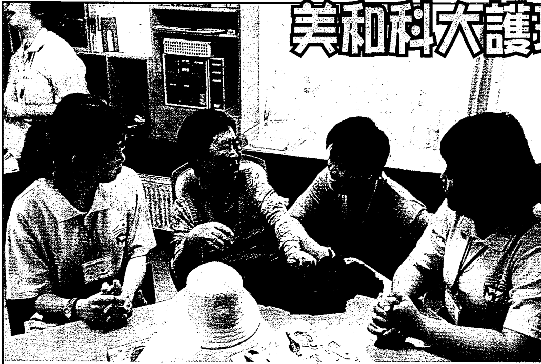
美和科大護理系學生共二十一名前往日本展開海外實習之旅，圖為護理系學生透過翻譯老師與日本受照護的老人互動情形。

〔記者張丞仁屏東報導〕屏東內埔私立美和科技大學護理系為配合教育部「學海築夢計畫」，甄選學生共二十一名，今年七、八月分別前往日本福岡聖惠醫院、北海道一小樽介護所，及栃木縣足利市幸梅會介護老人福利機構，展開海