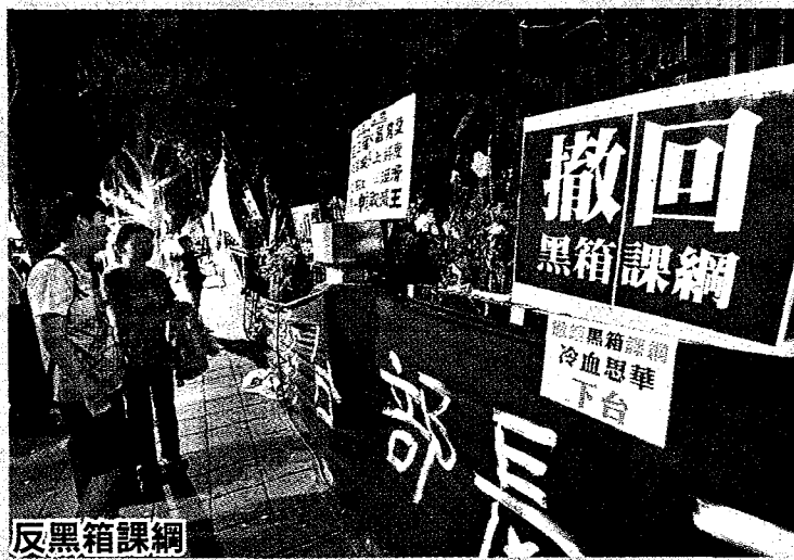
反黑箱課綱 馬政府時代違反程序正義，以黑箱方式惡搞社會領域課綱，硬置入大中國史觀欲洗腦下一代，引發震撼全國的反黑箱課綱行動。(資料照)

一連三天的課審大會將由教育部長葉俊榮親自主持，預計從基本理念開始審議，先由研修小組提出報告，課審大會委員提問，再依序進行「國中及普通高中、技術型高中、綜合型高中」三份社會領域審