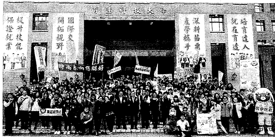
育達科技大學107年聯合登記分發率比去年成長許多。

此外，四技日間部及進修部單獨招生報名持續到8月中旬。校方爲加強新生及家長對在校生活的了解，另於107年8月11日辦理107學年度第二次新生註冊暨家長座談會，歡迎有興趣的同學一同參加，育達科大將是你最好的選擇。 民眾日報 4版