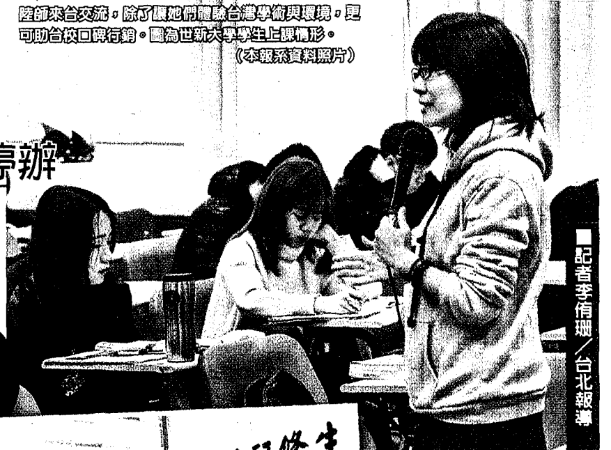
記者李侑珊／台北報導

福建省教育廳2015年釋出《福建省師資閩台聯合培養計畫實施方案》，原本計畫該年起運用3年的時間，協助大陸應用型本科高校（類似台灣的技術學院和科技大學）、職業院校培訓學科專業教師和管理幹部3000名，同時也與台灣多所大學合作，其中包含東吳、世新、銘傳、逢甲及雲科大等校，而校務管理幹部閩台聯合培養中心則設在廈