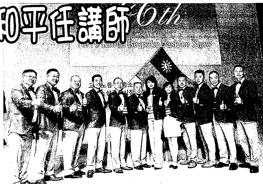
中華民國服裝甲級技術士會與台南應用科大將於八月十八日下午二時三十分舉辦「米蘭釦眼」研習活動。