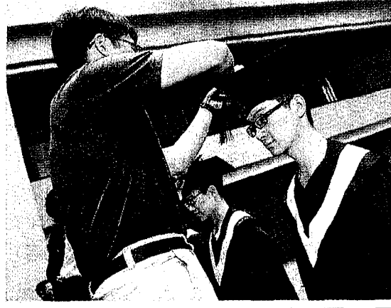
◀3+1閩台教育交流計畫，即派送福建陸生來台灣的大學短期交流。圖為元智大學師生與福建師範大學15級閩台班師生交流研習活動。