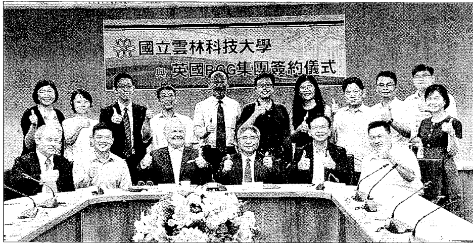
雲科大深耕再生能源全球化人才培育-與英國RCG集團締約合作綠能推動專案