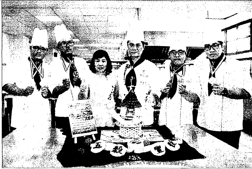
→彰化縣中州科大學生參加第二十一屆全國美食文化大展獲四金三銅佳績。