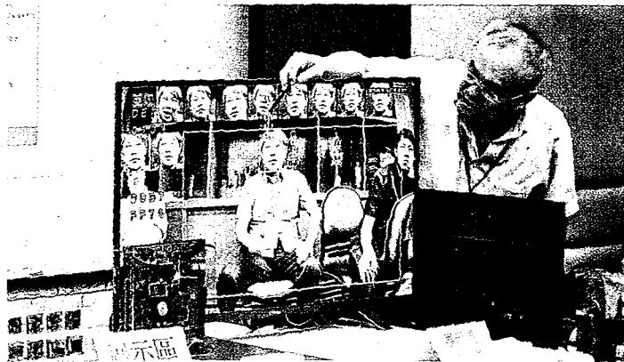
台師大與視芯科技共同發表的「AI小鼠Mipy」產品記者會。