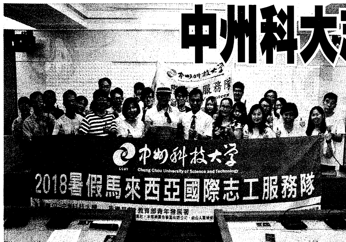
中州科大暑期國際志工服務隊前進馬來西亞，出發前舉行授旗儀式。

【本報記者莫漠員林報導】中州科技大學由15位師生組成的馬來西亞國際志工服務隊，於7月底到8月中旬前往馬來西亞柔佛州愛華小學及培華獨立中學進行國際志工服務，為2所學校規畫了影視美學夏令營、影視動畫3D教學、團康活動及空拍教學，課後的時間志工們則緊鑼密鼓為愛華小學及培華獨立中學拍攝宣傳影片，十幾天的服務工作雖然忙碌，但中州科大參與的師生都認為付出相當值得，也達到國際交流的目的。