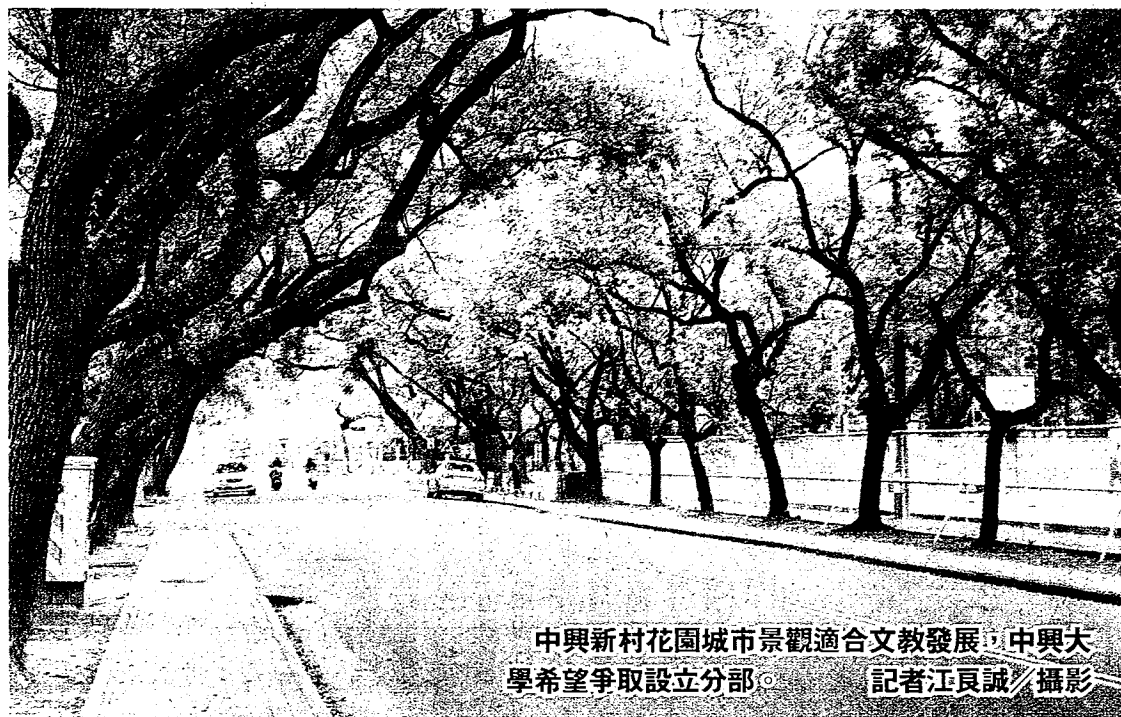
中興新村花園城市景觀適合文教發展，中興大學希望爭取設立分部。

轉型大學城 對文化景觀保存有利 南投縣府願全力配合 但土地與建物修繕...誰埋單？