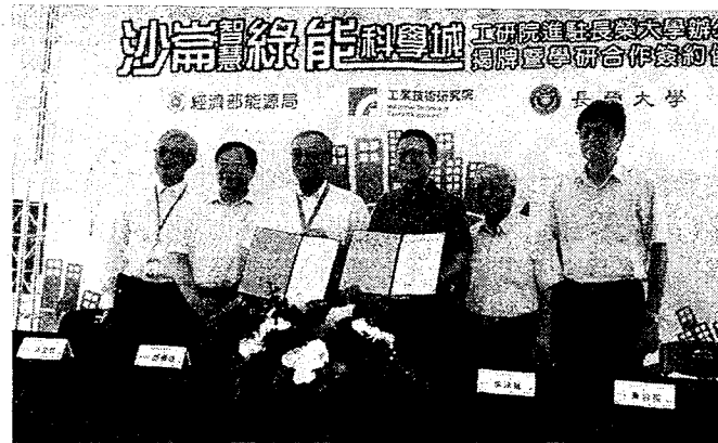
長榮大學成為工研院前進沙崙智慧綠能科學城的前哨站，雙方簽署合作意向書。