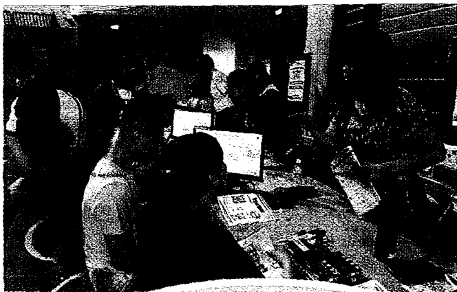
新生說明會暨校園導覽。