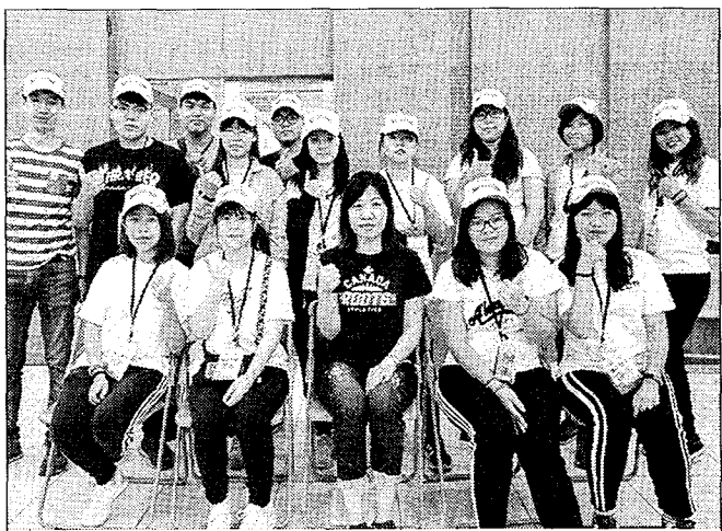
中國科技大學管理學院與二〇一八環保小尖兵體驗夏令營師生。

中國科技大學管理學院學生此次夏令營共十四位來自企業管理系與行銷與流通管理系的校友、大四、大二的同學參與，擔任小隊輔導員帶領小學生一起共同成長，從小紮根環境保育觀念，親身了解乾淨的空氣與健康呼吸的重要性，並擁有難得的生態保育體驗與團體生活的成長經驗。行銷與流通