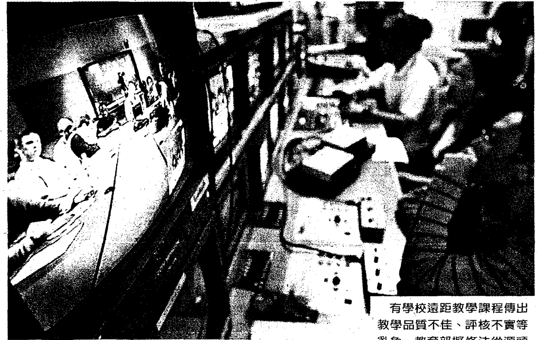
有學校遠距教學課程傳出教學品質不佳、評核不實等亂象，教育部擬修法從源頭管控。