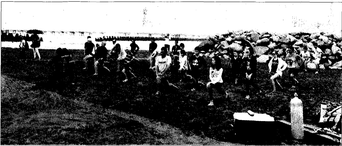
↑ 高科大舉辦親子海洋嘉年華，親子參加開放性水域安全教育，學習防溺救溺招式。

時值暑假炎熱之際，親子們獲得遇到危險時如何落實救溺五步與防溺十招，一旦遭遇，即可化險為夷，直說這是最有意義的活動。