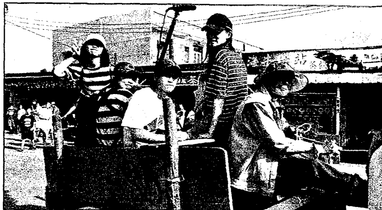
大葉傳藝學程師生前進芳苑鄉 傳承「海牛耕蚵田」無形文化資 產。