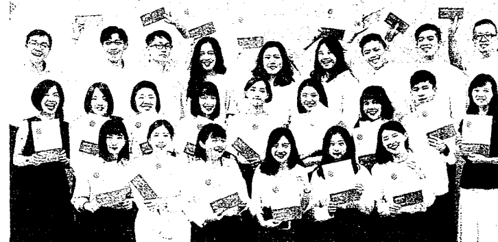
嶺東科大視傳系暨數媒系在德國紅點設計獎中，6組作品獲「新秀紅點獎」，創意產品設計系也獲「紅點概念設計獎」。