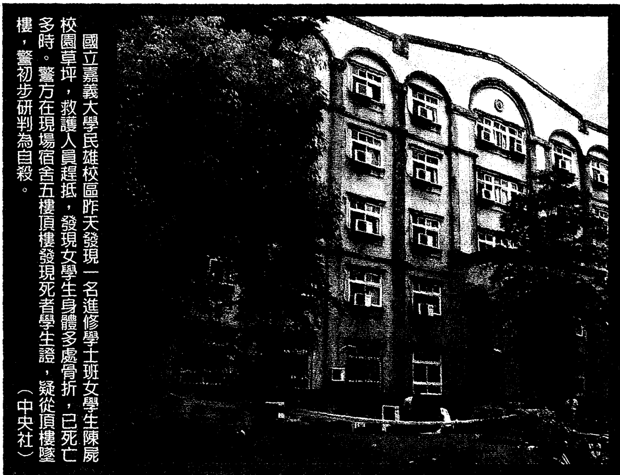
國立嘉義大學民雄校區昨天發現一名進修學士班女學生陳屍校園草坪，救護人員趕抵，發現女學生身體多處骨折，已死亡多時。警方在現場宿舍五樓頂樓發現死者學生證，疑從頂樓墜樓，警初步研判為自殺。 (中央社)

珍愛生命 求助電話 生命線:1995 張老師:1980 安心專線:0800788995