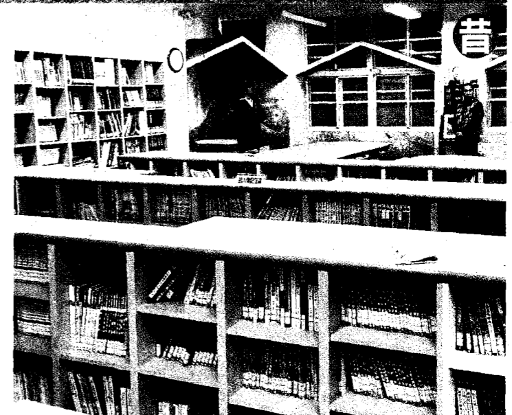
陳樹菊為母校仁愛國小蓋的圖書館二樓原本擺放許多書櫃。