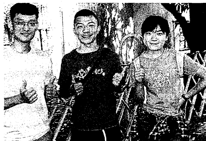
國立虎尾科技大學的師生，為老舊的虎尾鎮眷村，正式啟動活化再造一事，個個都樂開懷。

上，建請「眷村再造聲」的響起，以及雲林縣政府、虎尾鎮公所、國立虎尾科技大學、地方社區發展協會等單位的「大力推動」，直到去年間，即因行政院文化部、雲林縣政府文化處等單位，決定共同集資新台幣一億多元，並分「四年」的時間，辦理「眷村活化、再造」計劃，以致實現「虎尾眷村風華再現不是夢」的美夢，面對首期改造的舊有景觀，將注入「多元」的藝術元素，在虎尾鎮已經成為高鐵一日遊的生活園區，以及前瞻計劃的台糖五分車開闢即將推動，一旦工程竣工啟用，勢必使該眷村地區，成為虎尾鎮一處十分嶄新的休閒新景點。