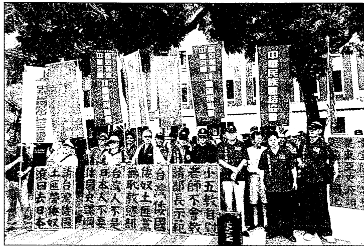
藍天行動聯盟等22個團體昨天到教育部前抗議高中歷史課綱「去中國化」。

【記者馮靖惠／台北報導】教育部課審大會正在審議12年國教社會領域課程綱要草案，藍天行動聯盟等22個團體昨天到教育部抗議，反對民進黨推動歷史課綱「自我奴化」，美其名曰重視區域而反對「天朝史觀」，骨子裡就是在進行「去中國化」。教育部則強調，新的歷史課綱能讓歷史教育擺