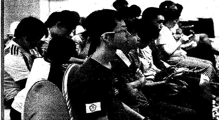
▲台灣青年求學就業講座，吸引近百名學子及家長參加。

目前大陸推動世界一流大學（42所）和一流學科（95所）的「雙一流」，而且是採取滾動淘汰方式，台灣青年選擇學校或科系時，可參考。目前台灣承認大陸學校約150所。